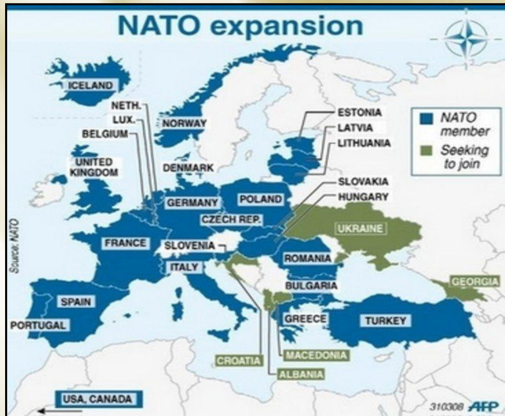
Страны-члены НАТО и желающие вступить в блок