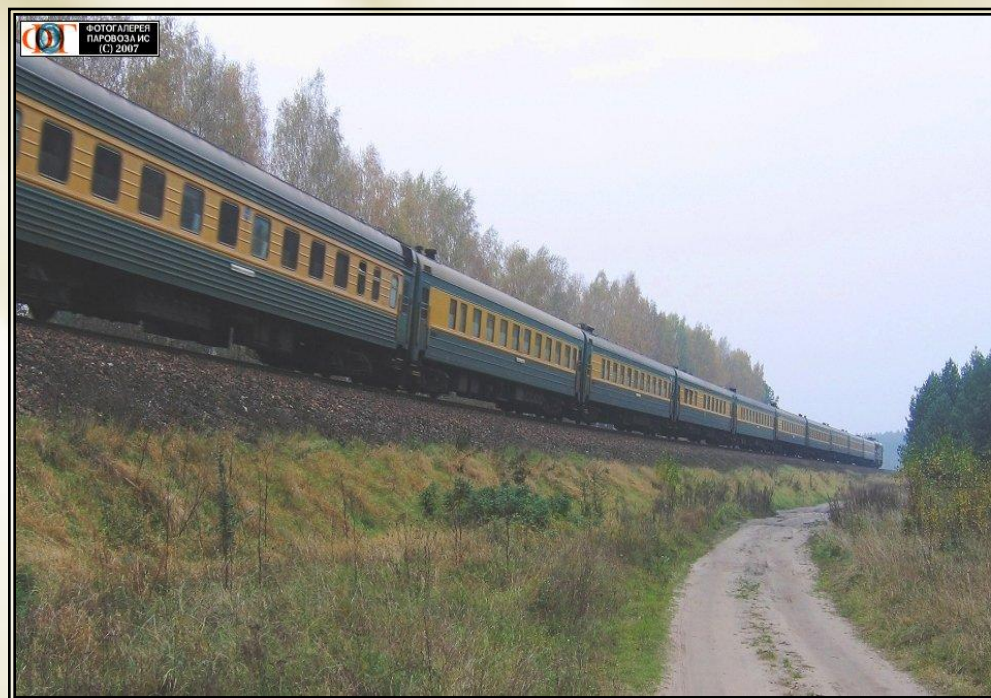
Поезд Санкт-Петербург - Калининград