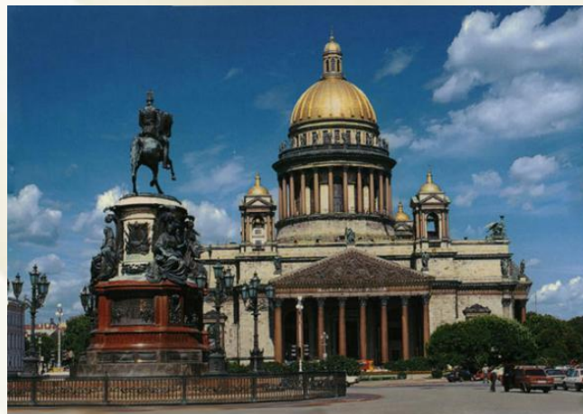
Санкт- Петербург, вид на Исакиевский собор.