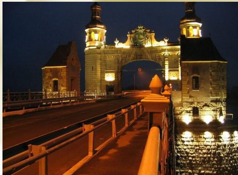
Граница с Литвой. Советск. Мост королевы Луизы