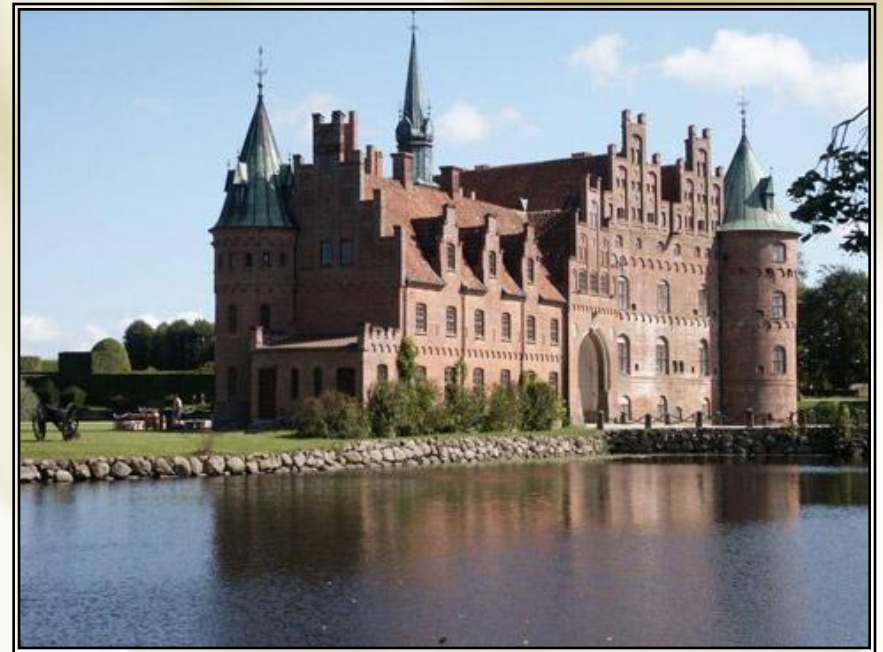
Замок Эгескув. Зеландия. Дания