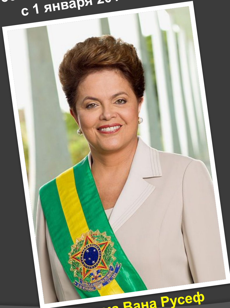
Дилма Вана Русефф

36-й президент Бразилии с 1 января 2011 года