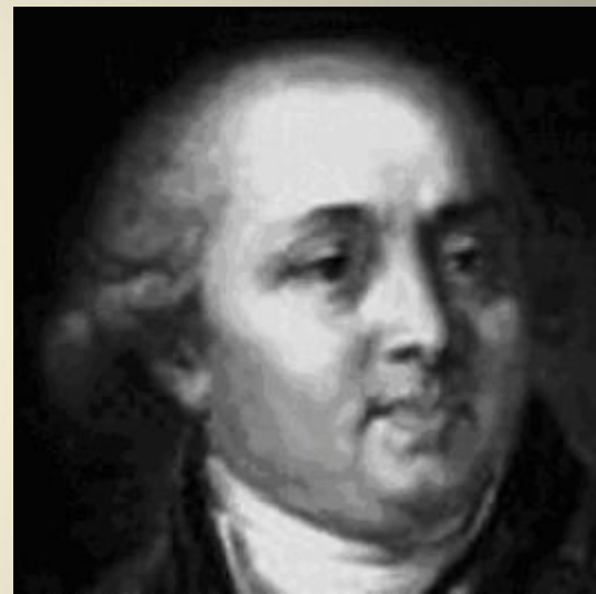
СТАРОВ Иван Егорович русский архитектор