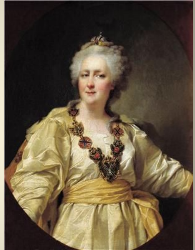
Императрица Екатерина Вторая

Таврический дворец был построен по указанию Екатерины II для своего фаворита, светлейшего князя Г. А. Потёмкина. На возведение и отделку дворца было затрачено около 400 000 рублей золотом. Дворец получил своё название по его титулу Князь Таврический, который был пожалован ему в 1787 году, после присоединения к Российской империи Крыма (Таврии). От названия Таврического дворца происходят наименования Таврического сада, Таврической