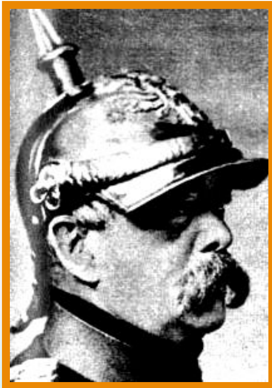
О. Фон Бисмарк

В союзе с Россией в н.80-х гг. были заинтересованы Германия и Франция.