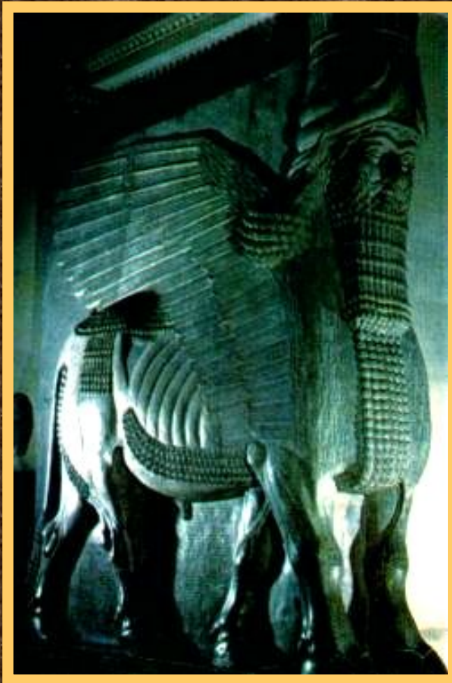
Статуя бога-шеду из дворца Саргона II в Дур-Шаррукине.

При царе Ашшурбанипале была собрана большая библиотека в царском дворце. В ней хранились вавилонские и ассирийские мифы и предания и астрономические трактаты записанные на глиняных табличках. Ассирийцы могли различать светила и созвездия.