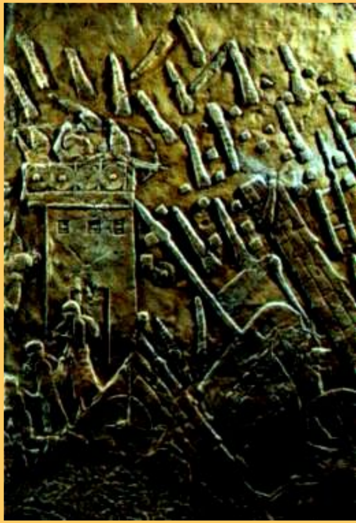
Осада Лахиша. Рельеф из дворца царя в Ниневии

Стены библиотеки украшались барельефами изображавшими подвиги царей.