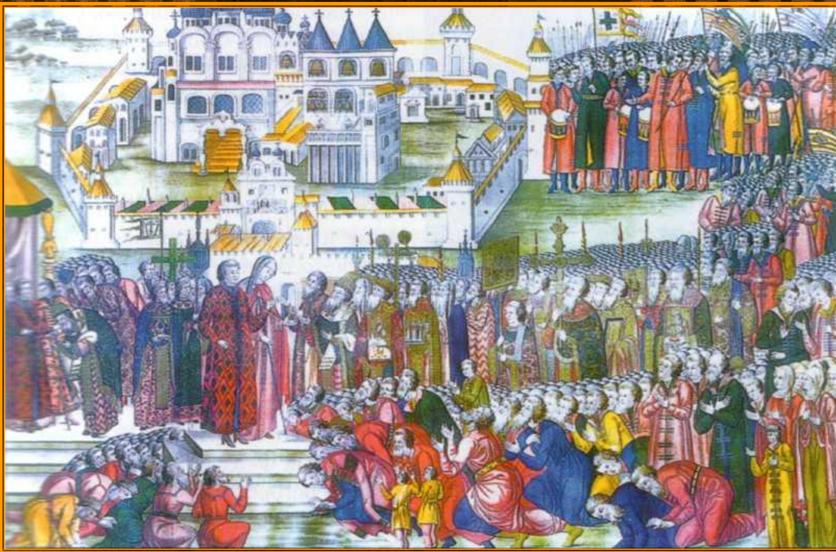
«Встреча великого Московского Посольства Михаилом Фёдоровичем Романовым у святых ворот Костромского Ипатьевского монастыря 14 марта 1613 года» Литография середины XIX века