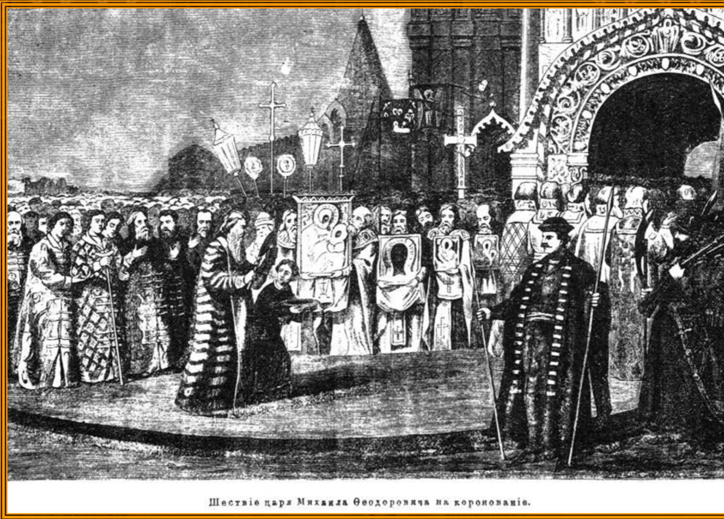
Шествіе царя Михаила Феодоровича на коронованіе.

Так в России закончилось «Смутное время»