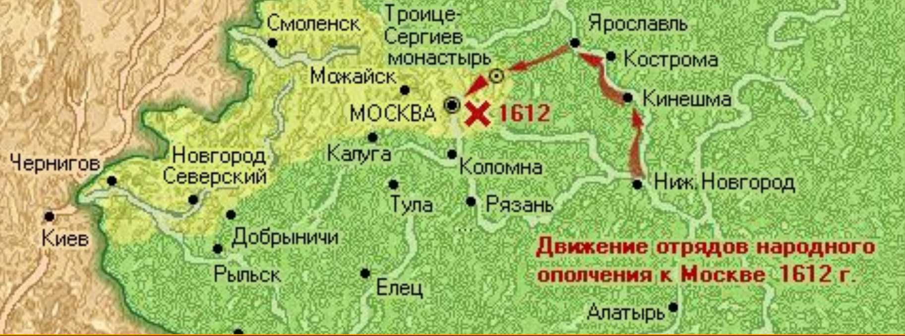
Костромичи в составе народного ополчения дошли до Москвы