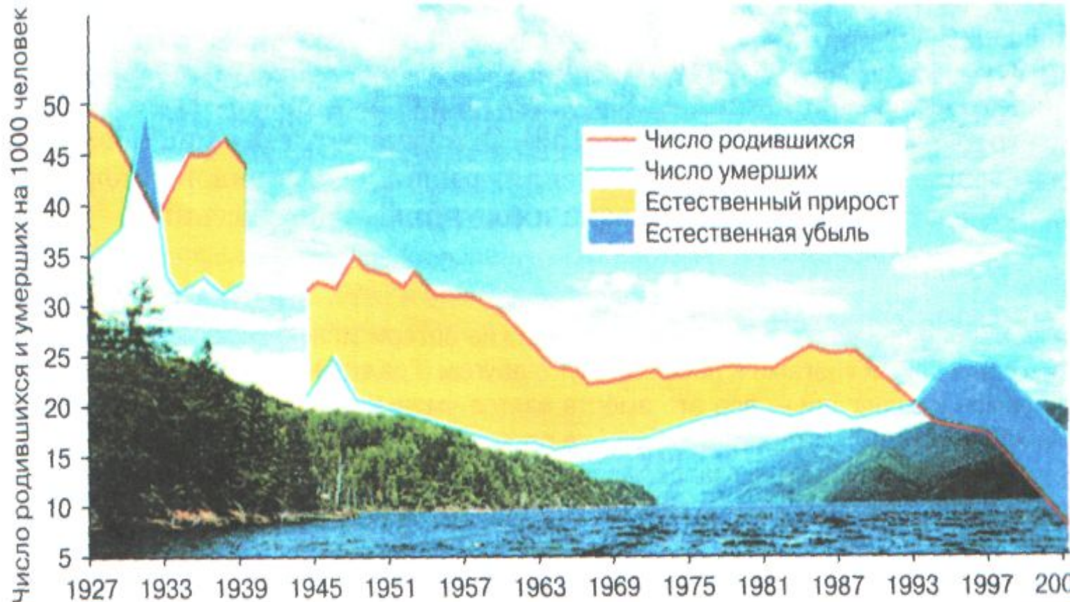
Рис. 172. Естественное движение населения России (по Е. М. Андрееву, Л. Е. Дарскому, Т. Л. Харьковой)

2. На какие годы приходятся критические периоды в естественном движении населения? Почему на графиках нельзя достоверно отразить период Великой Отечественной войны (1941—1945)?