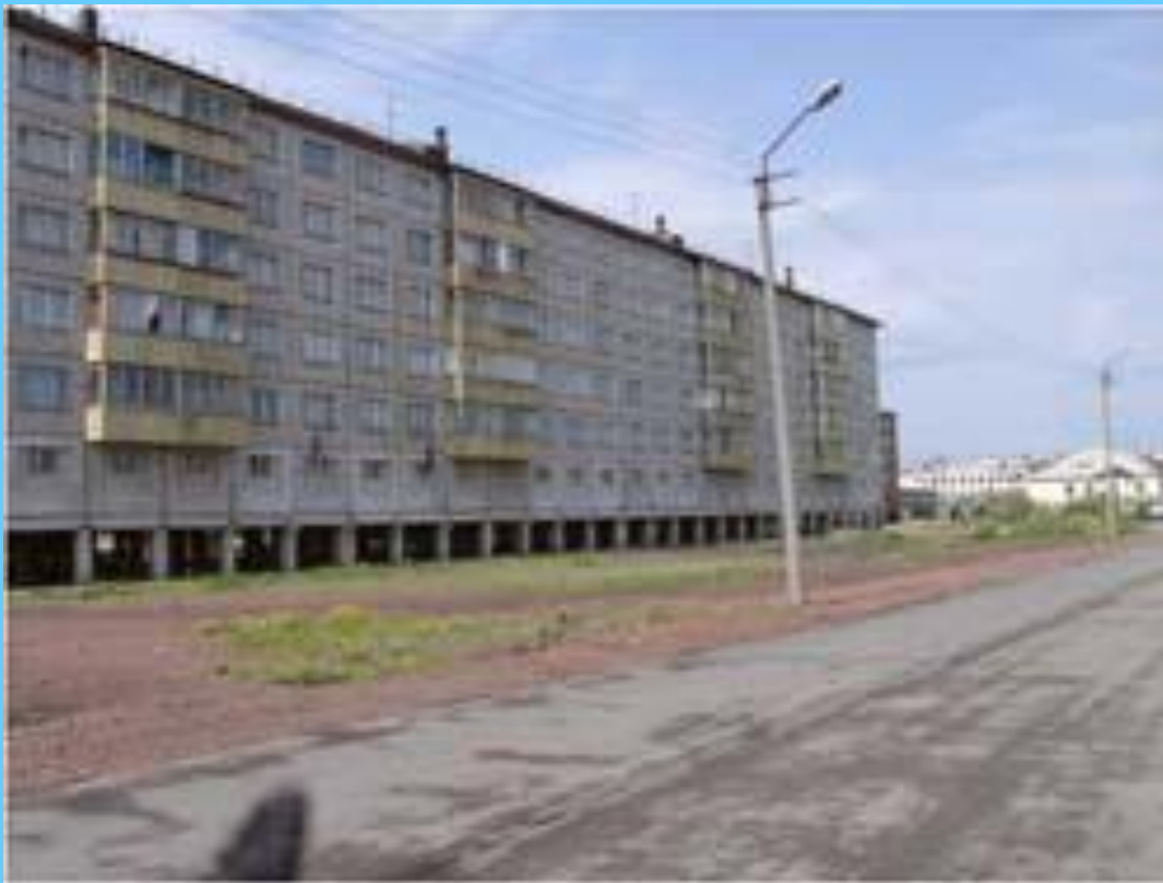
Дома на сваях в Норильске

Как повлияет потепление климата на площадь распространения многолетней мерзлоты? К каким последствиям это может привести?