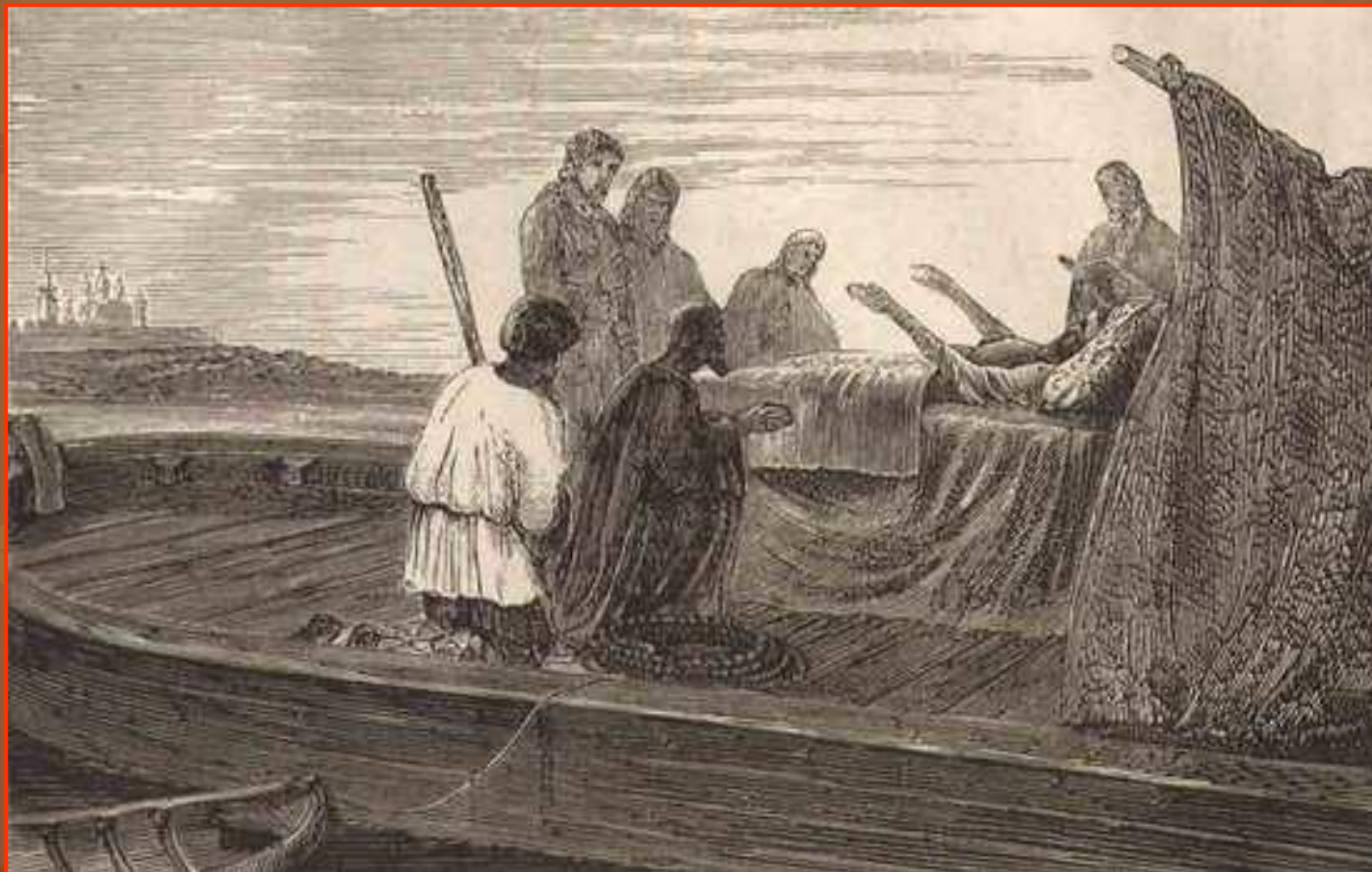
Смерть патриарха Никона (гравюра, 1870-е годы)

В 1681 году Никону разрешили переехать в Вознесенский Новоиерусалимский монастырь. Однако престарелый Никон умер в дороге близ Ярославля 17 августа 1681года.