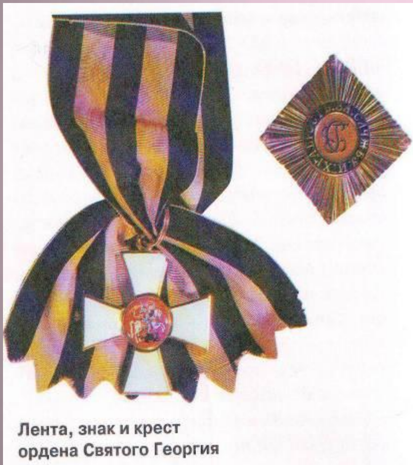
Лента, знак и крест ордена Святого Георгия