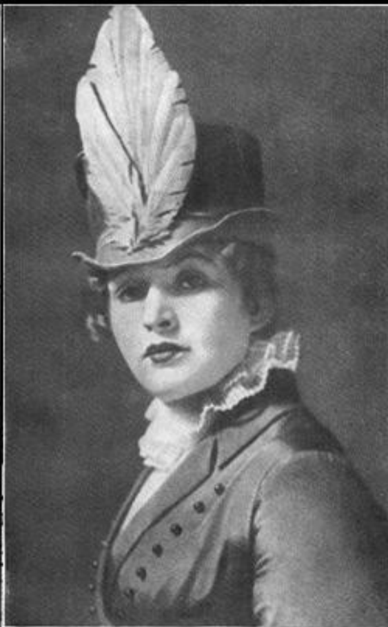
З. П. Райх и роль Софьи («Горе от ума», спектакль театра В. Э. Мейерхольда).