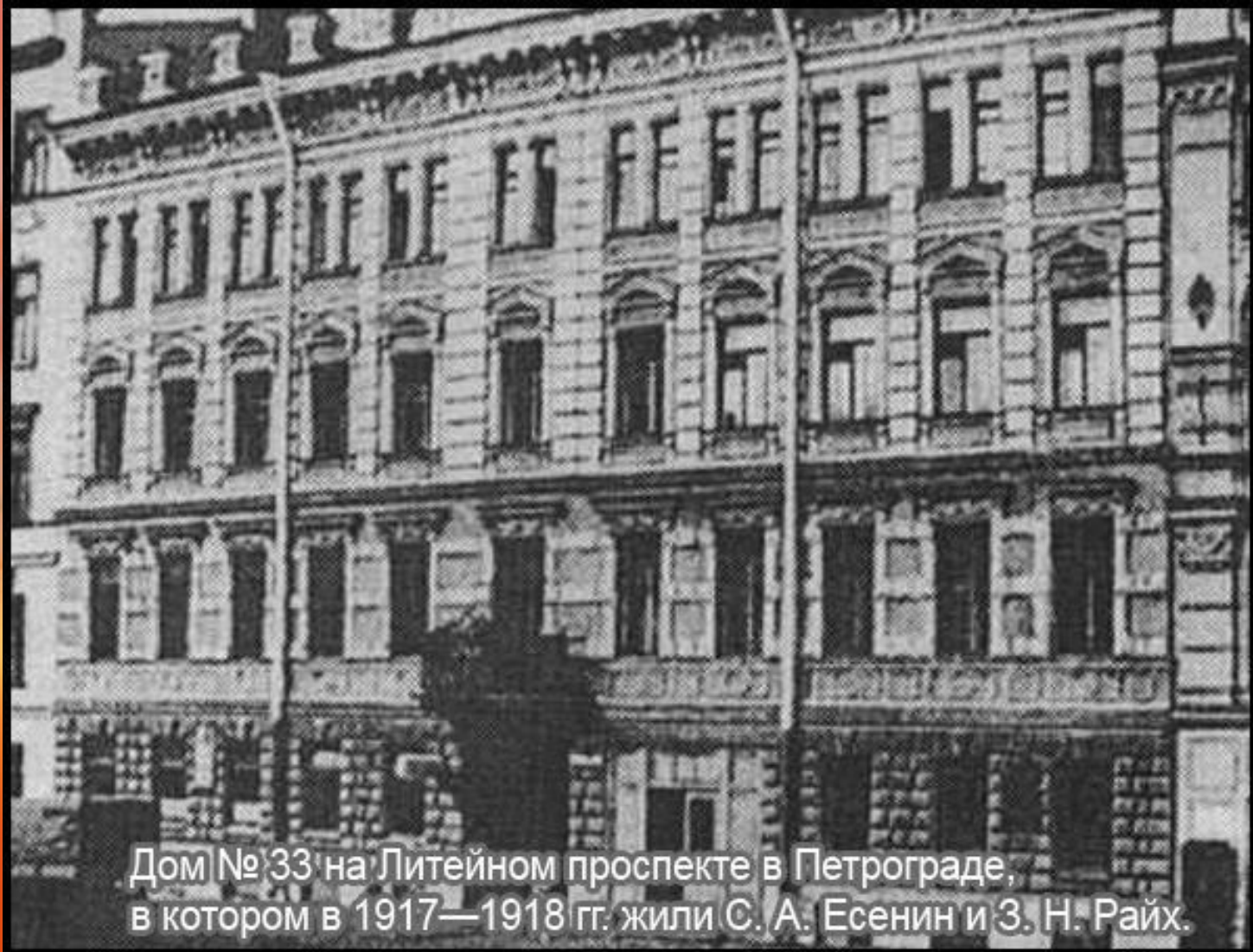
Дом № 33 на Литейном проспекте в Петрограде, в котором в 1917—1918 гг. жили С. А. Есенин и З. Н. Райх.

Они вернулись в Петроград, поселились в квартирке на Литейном и зажили вполне нормальной семейной жизнью без холостяцких попоек.