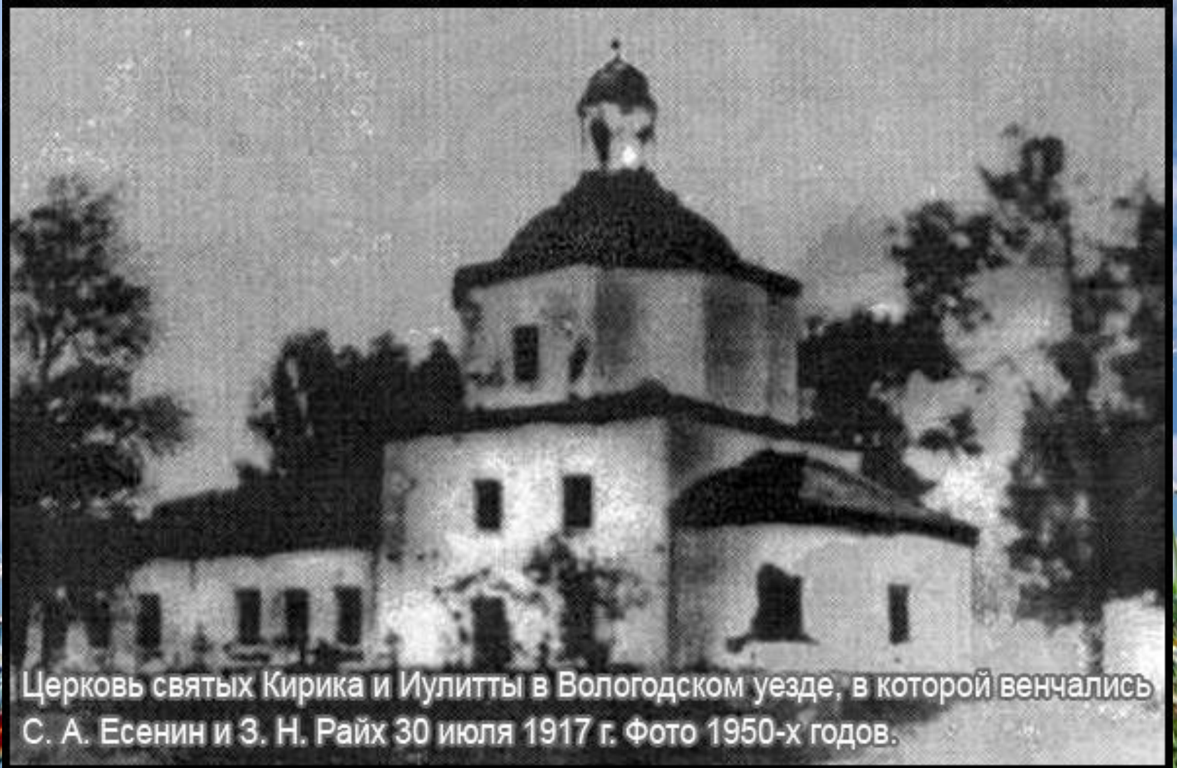
Церковь святых Кирика и Иулитты в Вологодском уезде, в которой венчались С. А. Есенин и З. Н. Райх 30 июля 1917 г. Фото 1950-х годов.

Не помня себя, забыв про Ганина, молодые обвенчались в маленькой церкви под Вологдой.