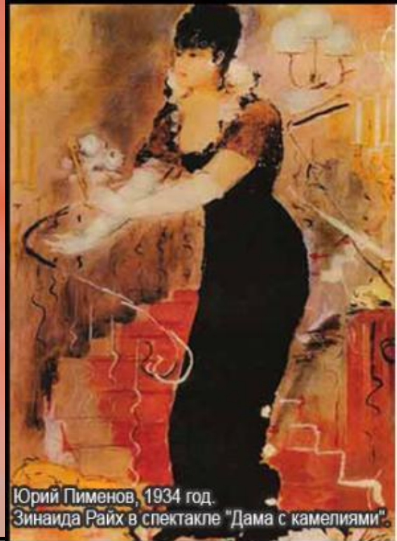
Юрий Пименов, 1934 год. Зинаида Райх в спектакле "Дама с камелиями".