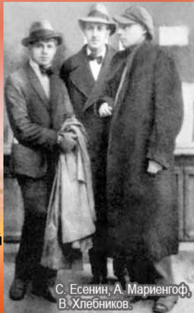
С. Есенин, А. Мариенгоф, В. Хлебников.