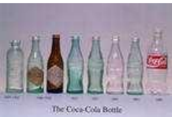
The Coca-Cola Bottle