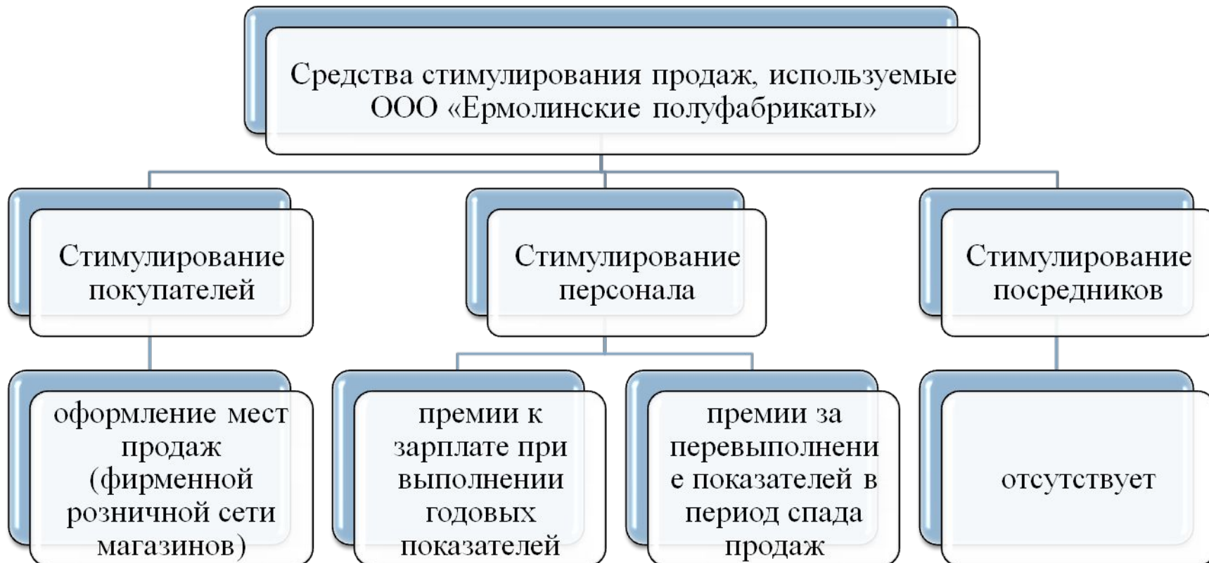
Рисунок 5 - Средства стимулирования продаж предприятия