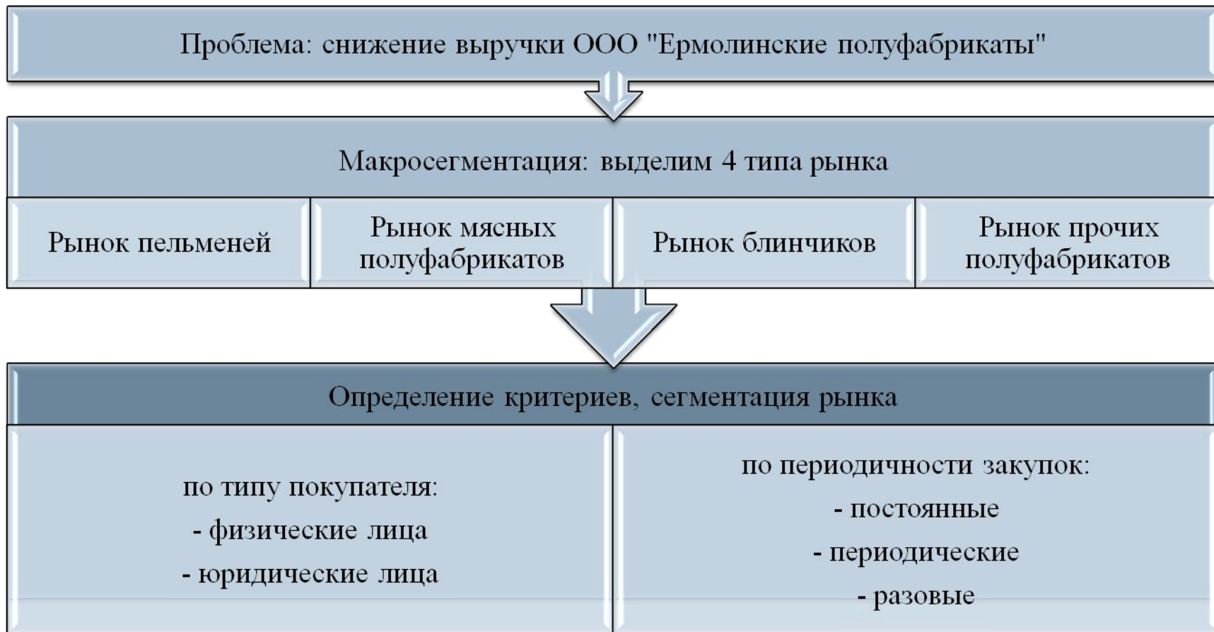
Рисунок 3 – Сегментация покупателей ООО «Ермолинские полуфабрикаты»