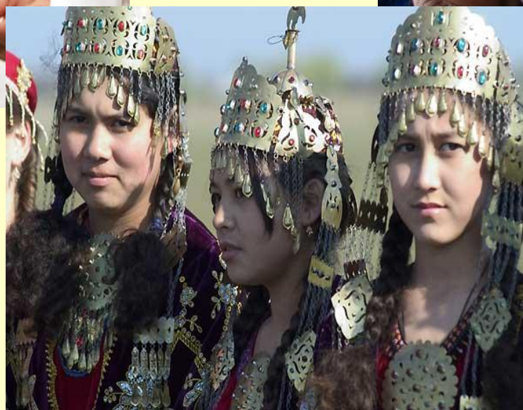
Туркмены, армяне и др. 7%