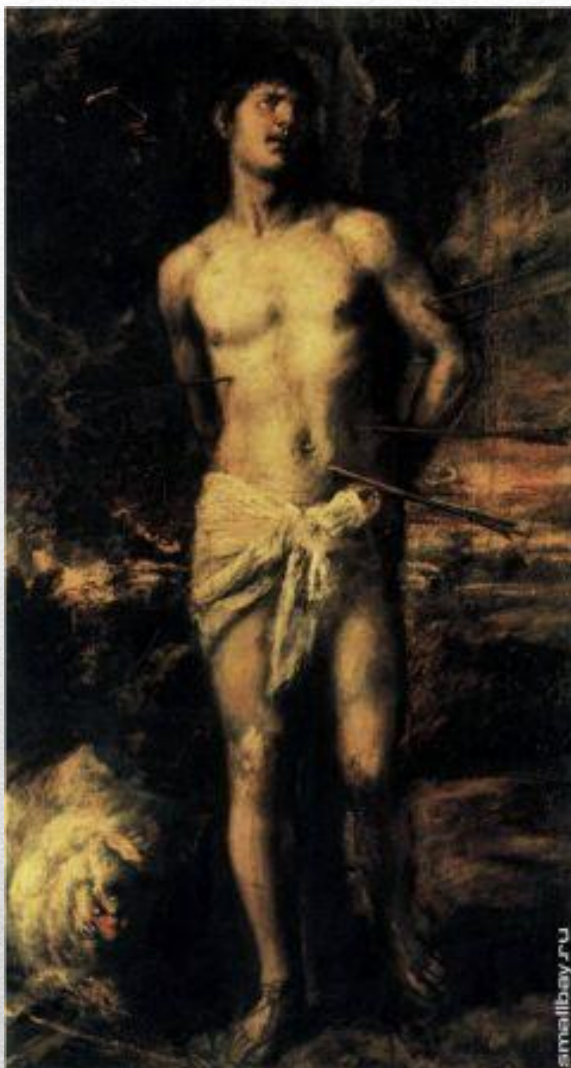
«Святой Себастьян», 1565-1570, Эрмитаж