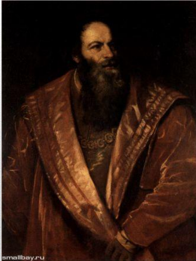
Пьетро Аретино (1545)