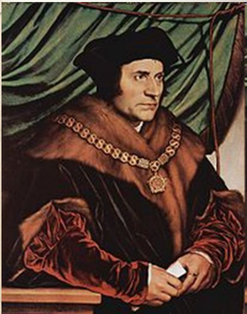
Томас Мор (1478 - 1535).

Английский мыслитель, писатель. Святой католической церкви.