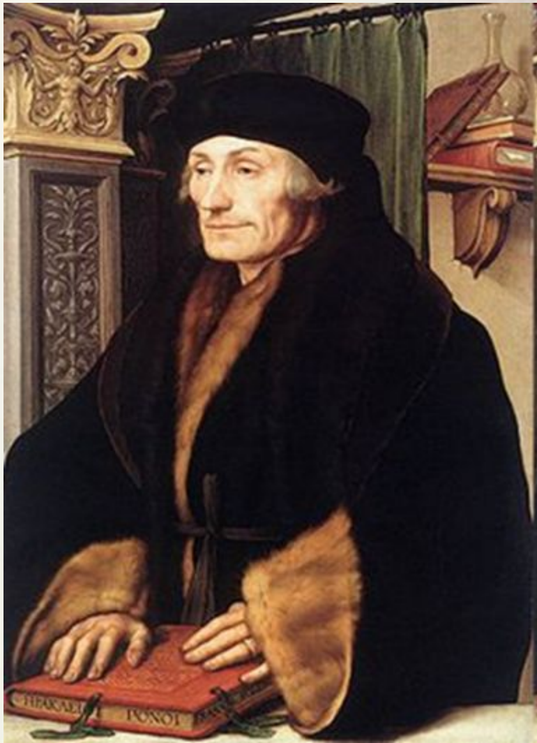
Эразм Роттердамский (1469 - 1536)

С. Цвейг, писатель, биограф гуманиста, назвал гуманиста «славой и светочем своего времени».