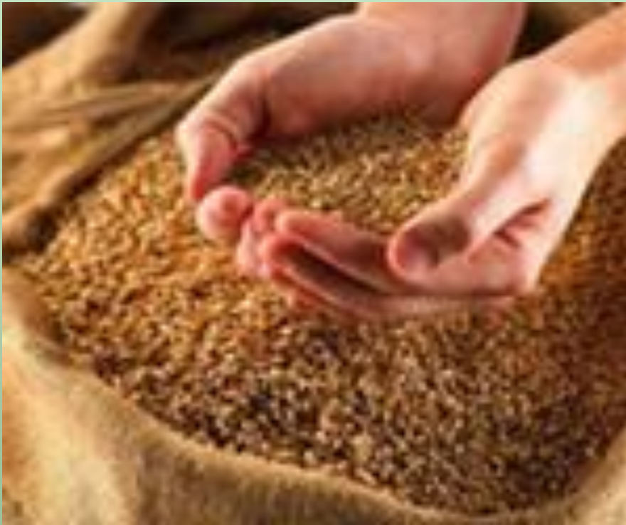
ЯЧМЕНЬ И ПШЕНИЦА