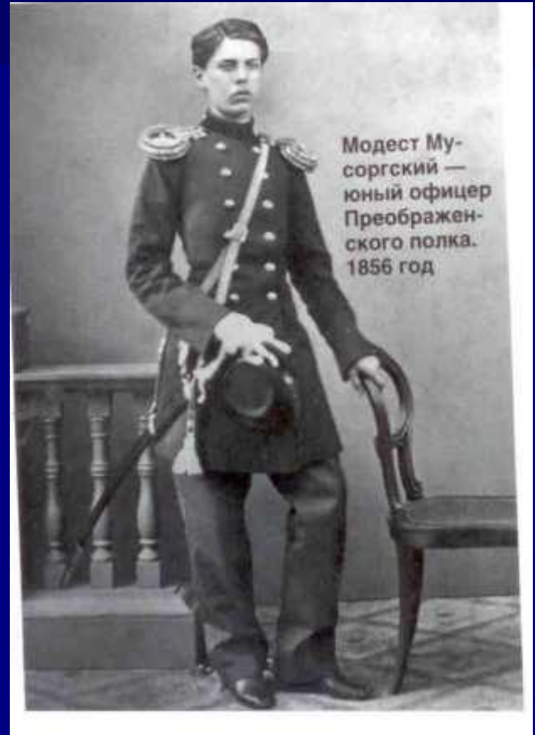
Модест Мусоргский — юный офицер Преображенского полка. 1856 год

А начиналось все идиллически – Мусоргский стал третьим постоянным участником балакиревских музыкальных вечеров. Случилось это в 1857г., когда будущему гениальному композитору было все лишь 17 лет. Родина его – село Карево на Псковщине. Русская глушь, где сам «дух народной жизни», как говорил Модест Петрович, сохранился в неприкосновенности. Первые музыкальные опыты Мусоргского проходили дома под руководством матери. Десяти лет от роду потомка старинного дворянского рода отвезли в Петербург, в Школу гвардейских подпрапорщиков.