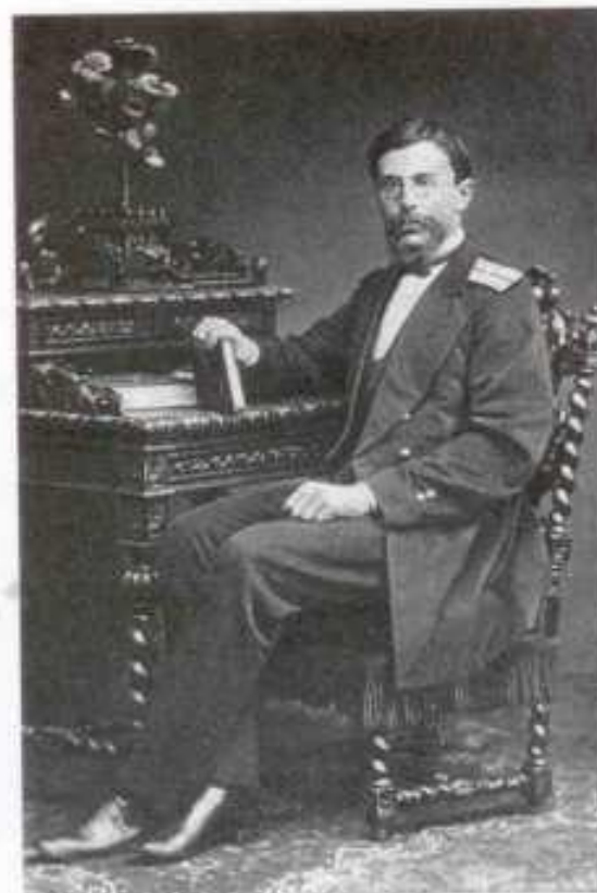
Счастливое семейство Римских-Корсаковых: Надежда Николаевна и Николай Андреевич. У них было семеро детей. Фото 1870-х годов

На одном из вечеров Римский-Корсаков знакомится с очаровательной пианисткой Надеждой Пургольд. Долгие романтические прогулки в окрестностях ее дачи в Парголово, совместное чтение и проигрывание музыкальных произведений... Николай Андреевич понимает: эта девушка – его судьба, пора делать ей предложение.