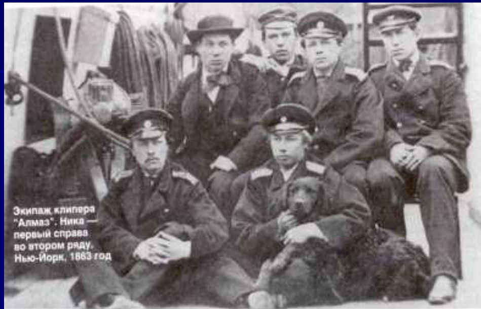
Экипаж клипера "Алмаз". Никол первый справа во втором ряду. Нью-Йорк, 1863 год

Римский-Корсаков происходил из древнего дворянского рода. Родился в старинном городке Тихвин Новгородской губернии. Здесь любили праздники, свято соблюдали обычаи – зиму провожали песнями и плясками, сжигали чучело Масленицы, весну встречали венками и хороводами, в ночь на Ивана Купалы жгли костры, а свадьбы справляли после уборки хлебов. Все это не раз наблюдал маленький Ника, прогуливаясь с матерью или дядюшкой в окрестностях города. Возвращаясь вечером, садились пить чай с вареньем.