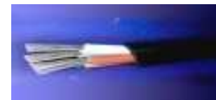
Бердянський кабельний завод