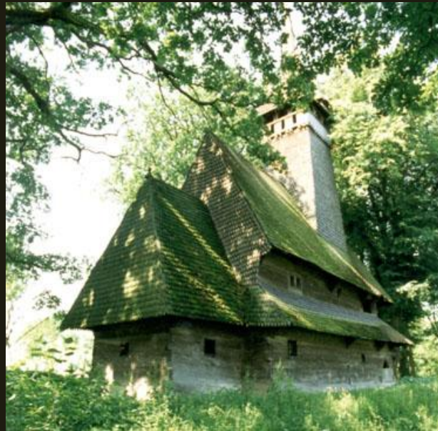
Церковь из с. Крайниково Закарпатской обл. 1668