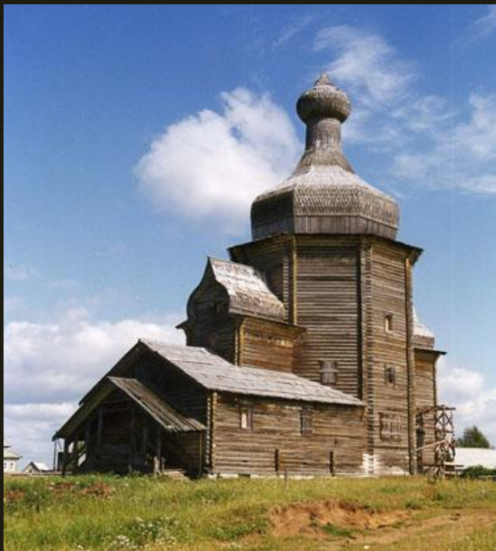
Церковь из с. Зачачье Емецкого р-на Архангельской обл. 1686

Церковь из села Зачачье относится к типу восьмерик от земли с двумя прирубами.