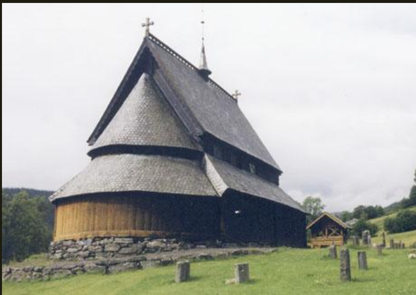
Церковь из с. Рейнли. Конец XIII в.