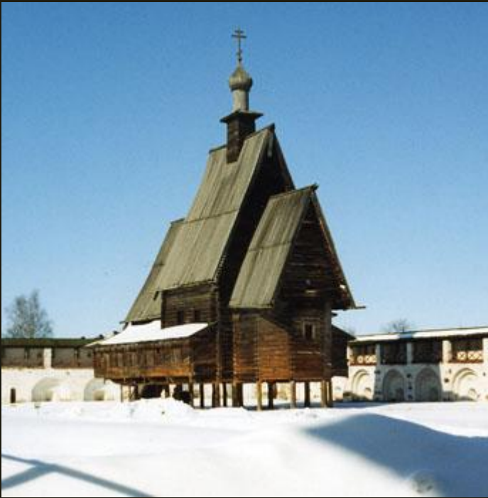
Церковь из с. Спас-Вежи Костромской обл. 1628

Типология русских деревянных храмов сложная.