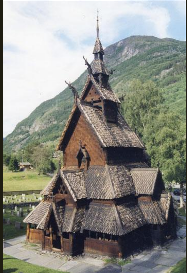
Церковь из с. Боргунд. XII в.