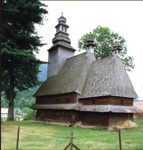
Церковь из с. Колочава Закарпатской обл. XVIII в.