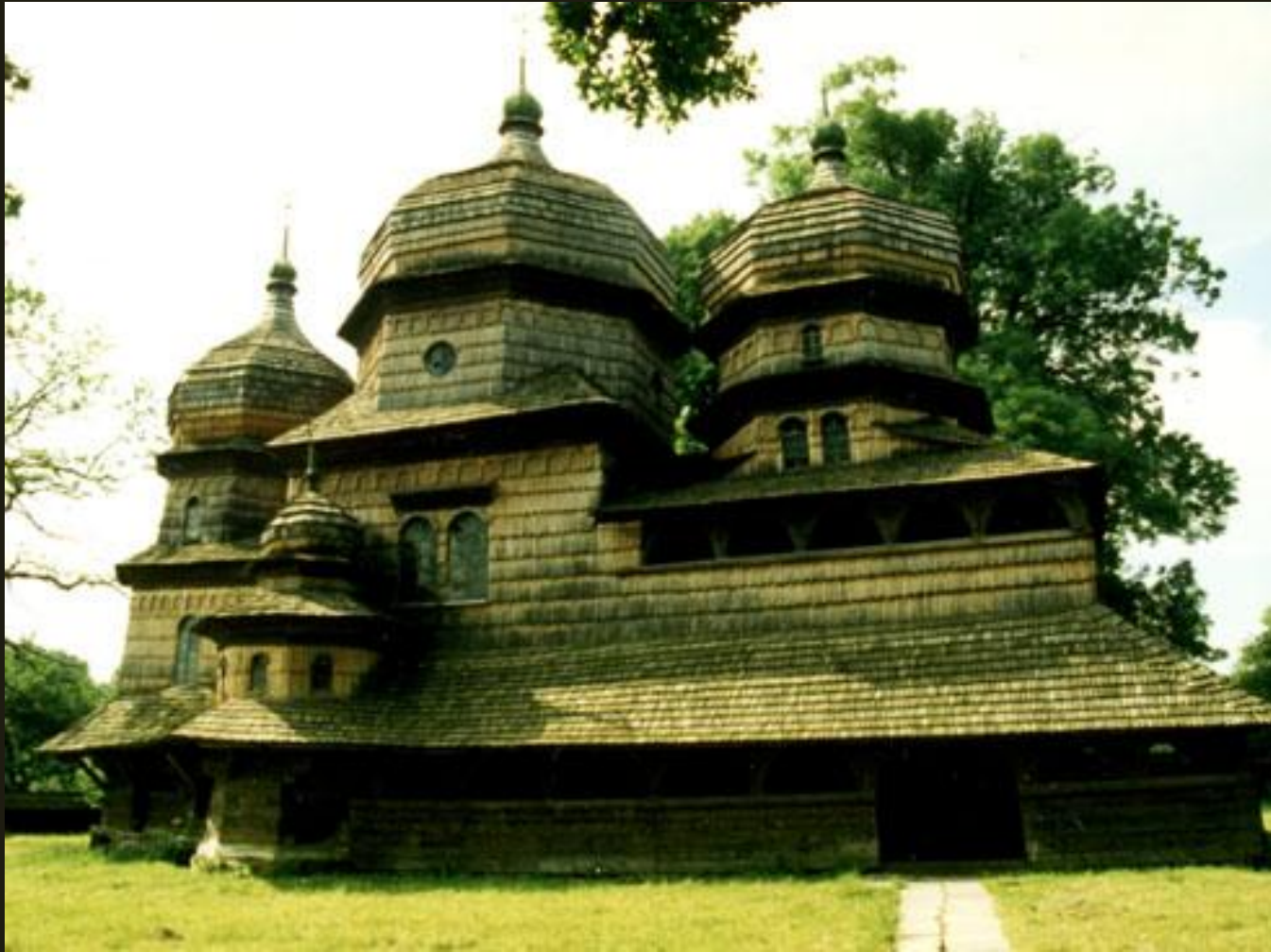
Церковь из с. Дрогобыч Львовской обл. Конец XV в.

Более ранняя постройка – храм святого Юра XV в. в Дрогобыче – трехсрубный.