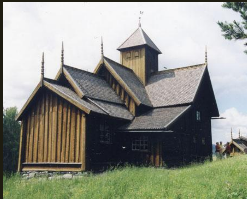
Церковь из с. Увдал. XII–XV вв.