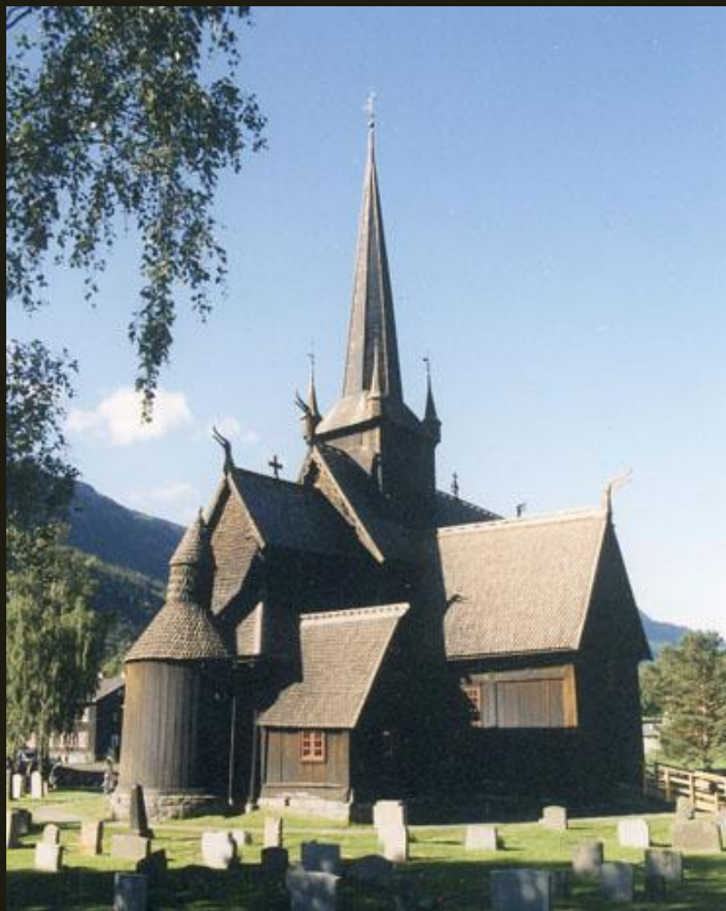
Церковь из с. Лом. XII–XIII вв.