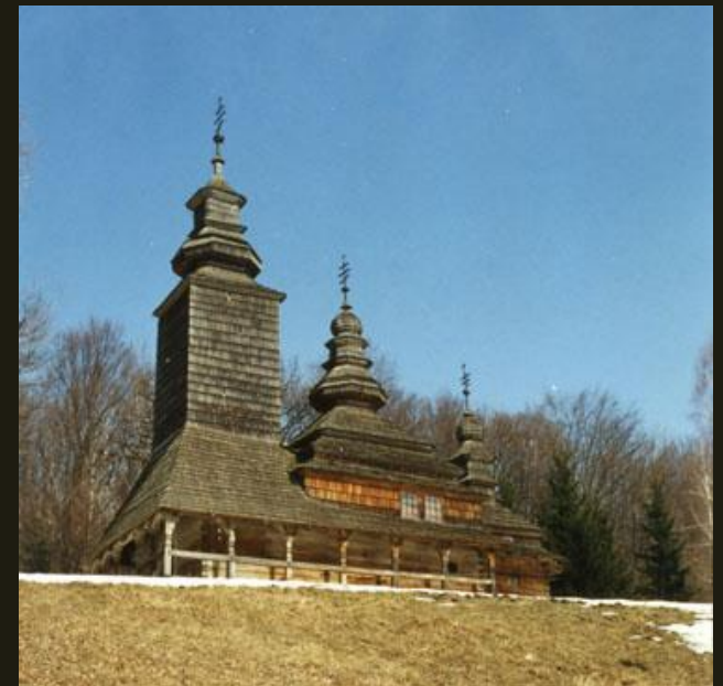
Церковь из с. Конора Закарпатской обл. 1745