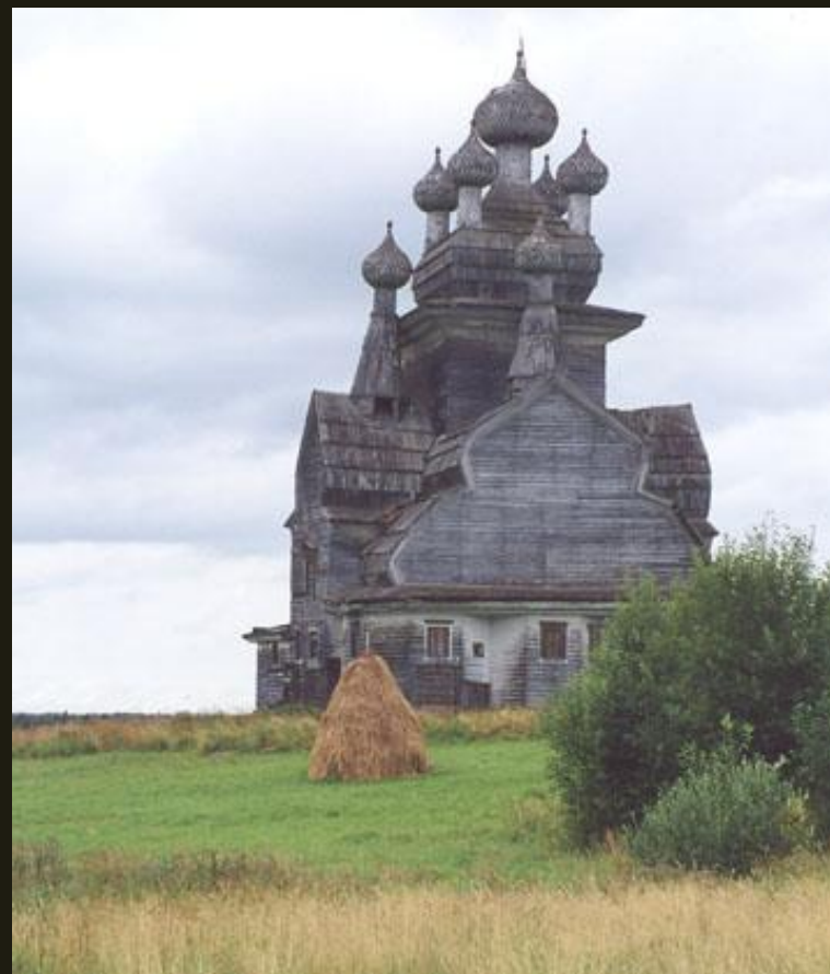
Церковь из с. Подпорожье Онежского р-на Архангельской обл.

Церковь из села Зачачье относится к типу восьмерик от земли с двумя прирубами.