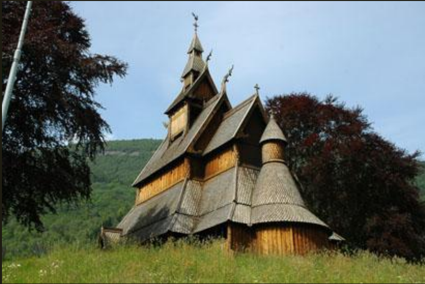
Церковь из с. Хопперстадт. XII в.