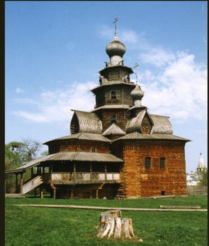
Церковь из с. Козлятьево Владимирской обл. 1756

Церковь Преображения из села Козлятьево относится к ярусному типу храма (распространенному в средней полосе России).