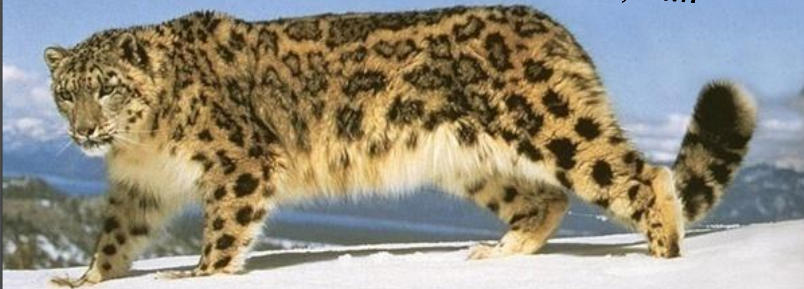
Снежный барс (Ирбис)