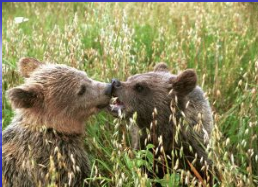
медведи на овсах