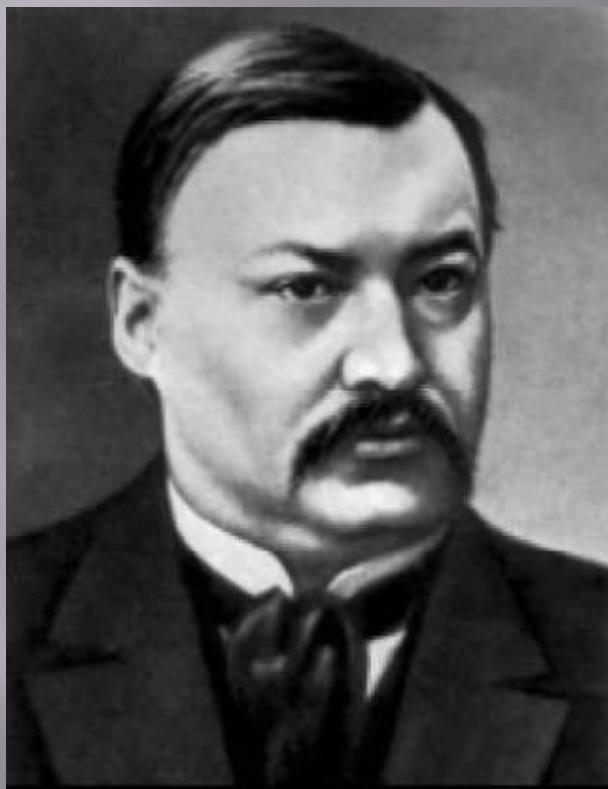
А. К. ГЛАЗУНОВ