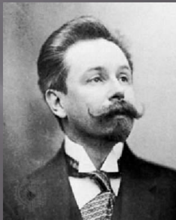
А. Н. СКРЯБИН