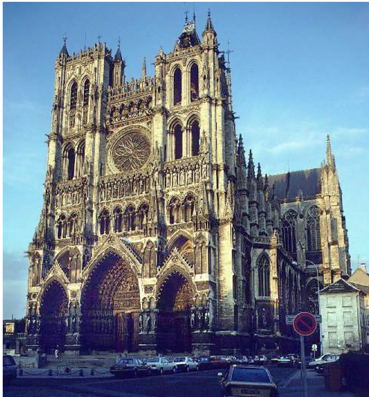
Собор в Амьене