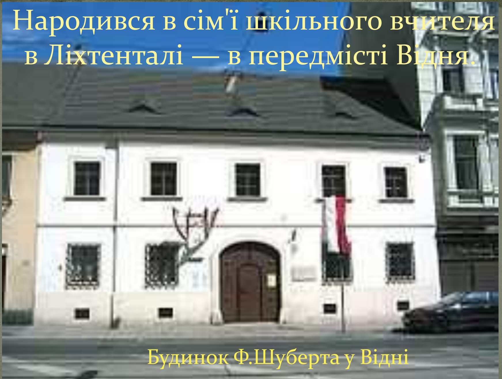
Будинок Ф.Шуберта у Відні

Народився в сім'ї шкільного вчителя в Ліхтенталі — в передмісті Відня.