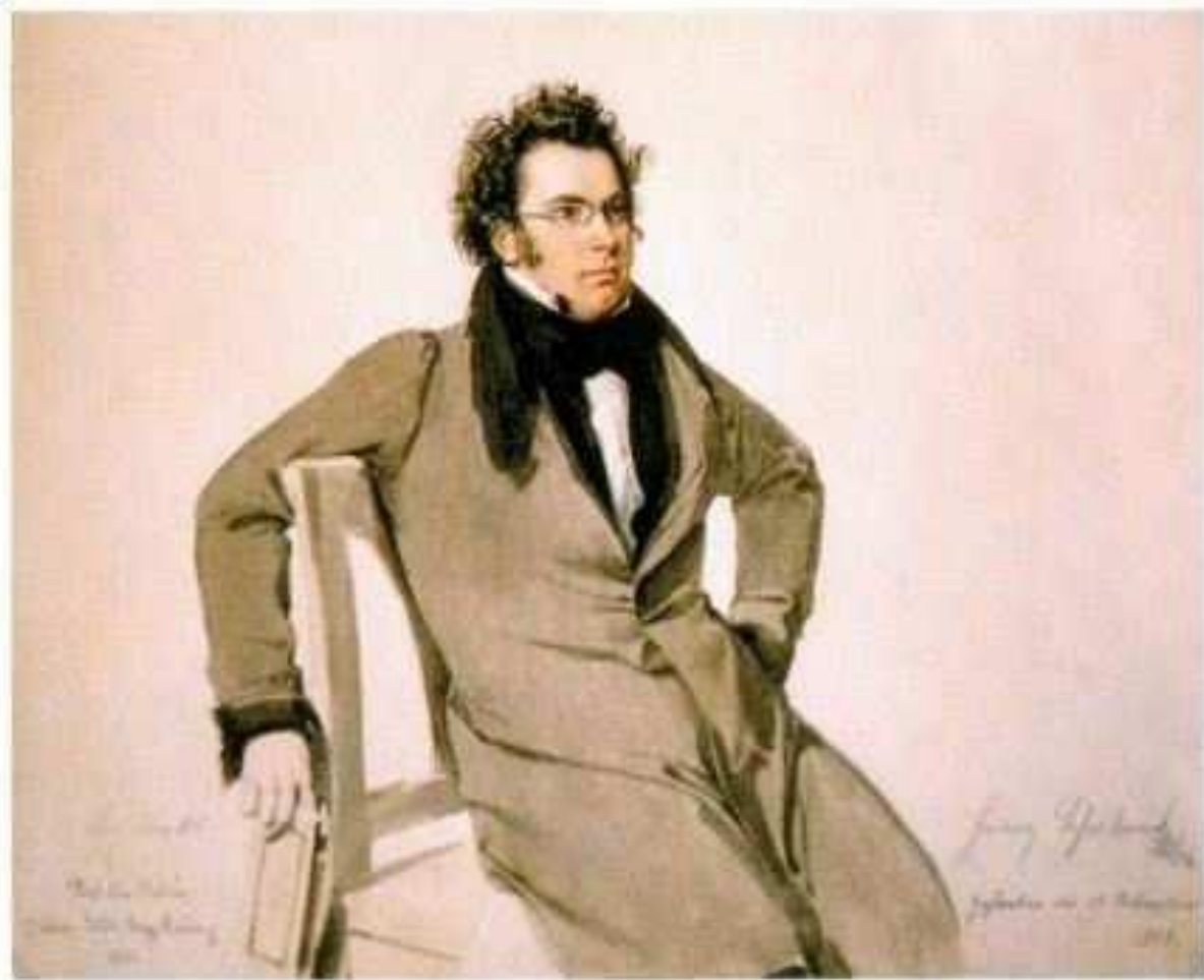
Франц Петер Шуберт в мае 1825 г. Портрет работы В.А. Ридера.

1824 рік. Ф. Шуберт працював над струнними квартетами ля мінор і ре мінор («Смерть і Дівчина») і над октетом фа мажор, однак матеріальні проблеми змусили його знову повернутись до вчительської роботи у родині Естергазі.