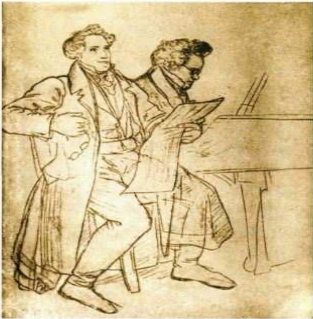
Фогль и Шуберт. Рисунок карандашом М.Швинда.

Літнє перебування в Желізі позитивно вплинуло на здоров'я Шуберта. Він написав там два опуси для фортепіано в чотири руки — сонату «Великий дует» до мажор і Варіації на оригінальну тему ля-бемоль мажор.