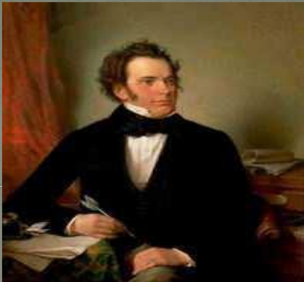
Франц Шуберт 1797 - 1828