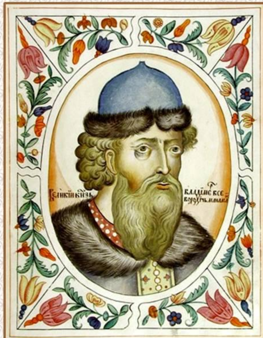
Великий князь Владимир Всеволодович Мономах. Портрет из Царского титулярника. 1672 год