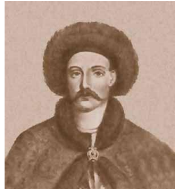
Всеволод в Переяславле