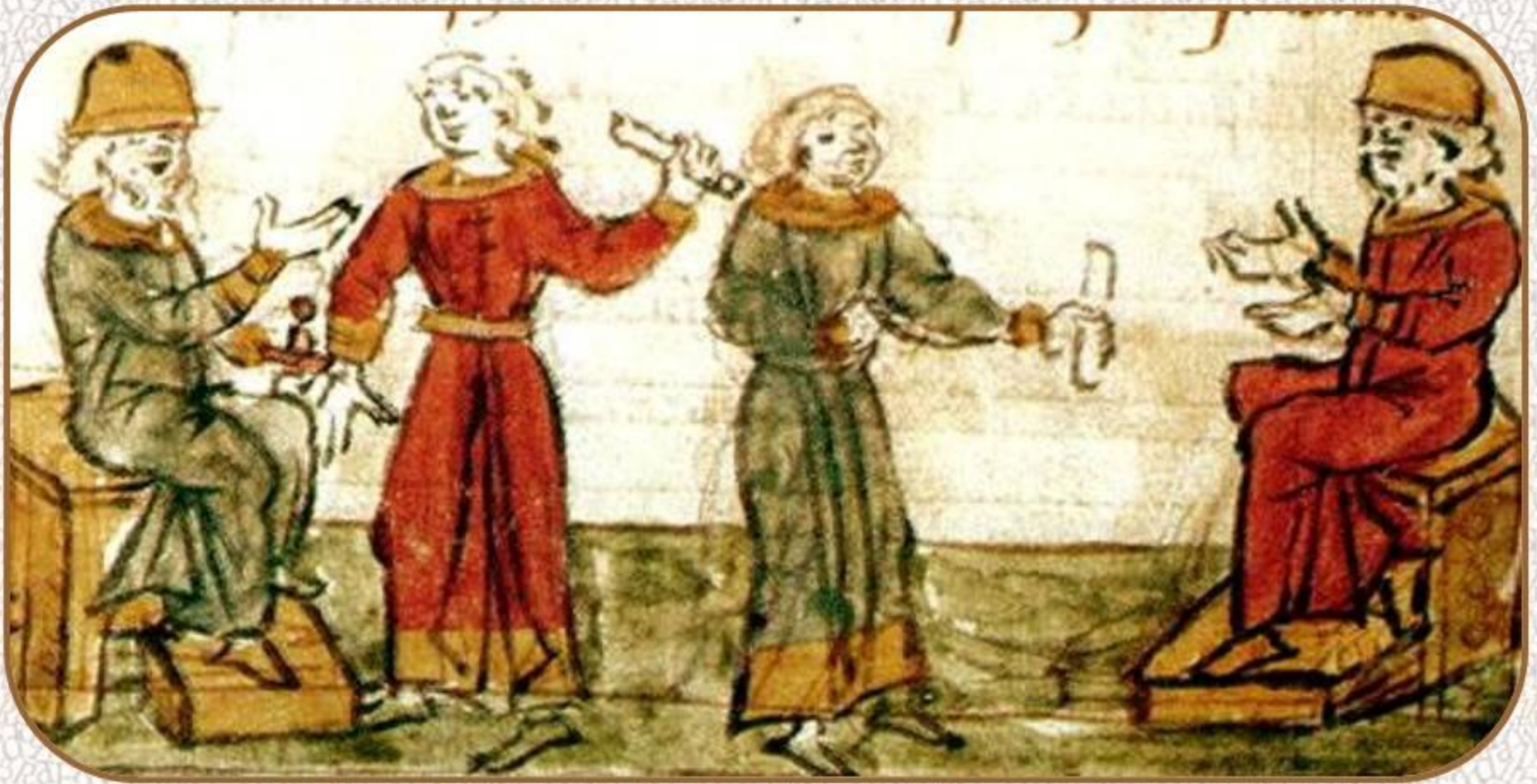
Распределение княжеских столов. Миниатюра Радзивилловской летописи

Князья договорились, кому какой вотчиной владеть, и целовали крест на том, что если кто заведет смуту, то идти на него всем князьям, всей землею.