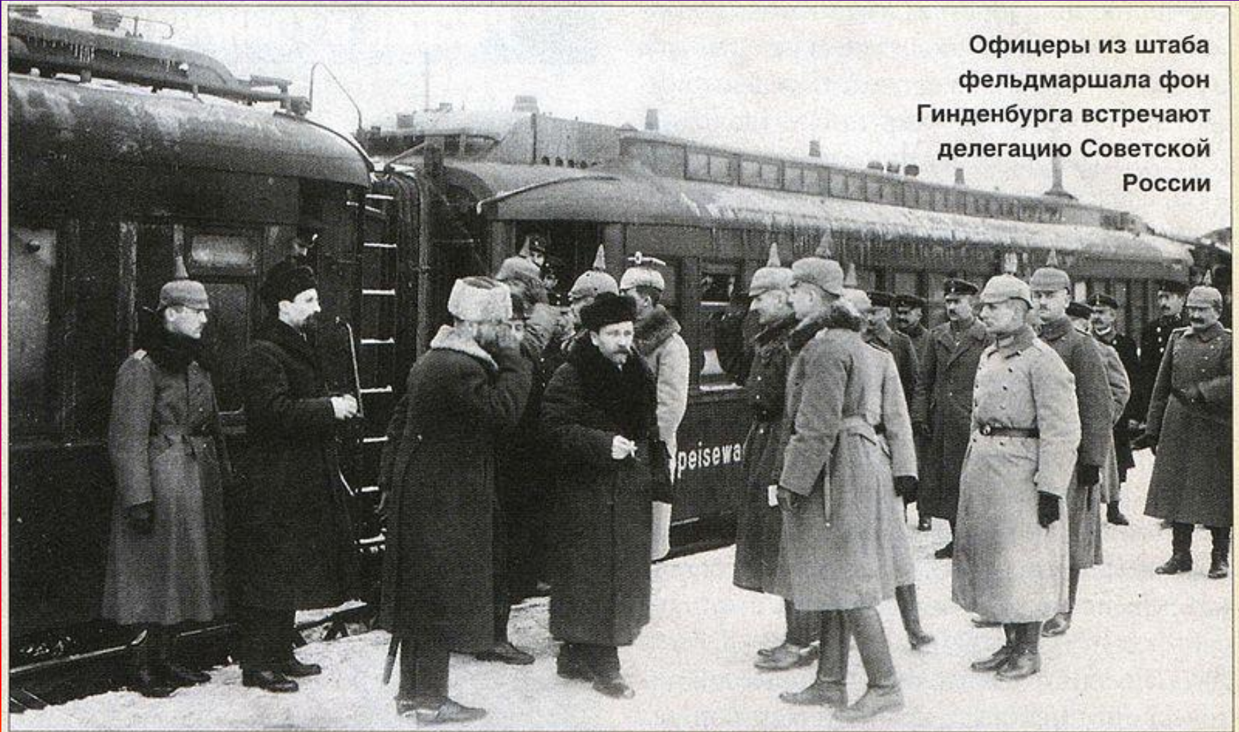
Офицеры из штаба фельдмаршала фон Гинденбурга встречают делегацию Советской России