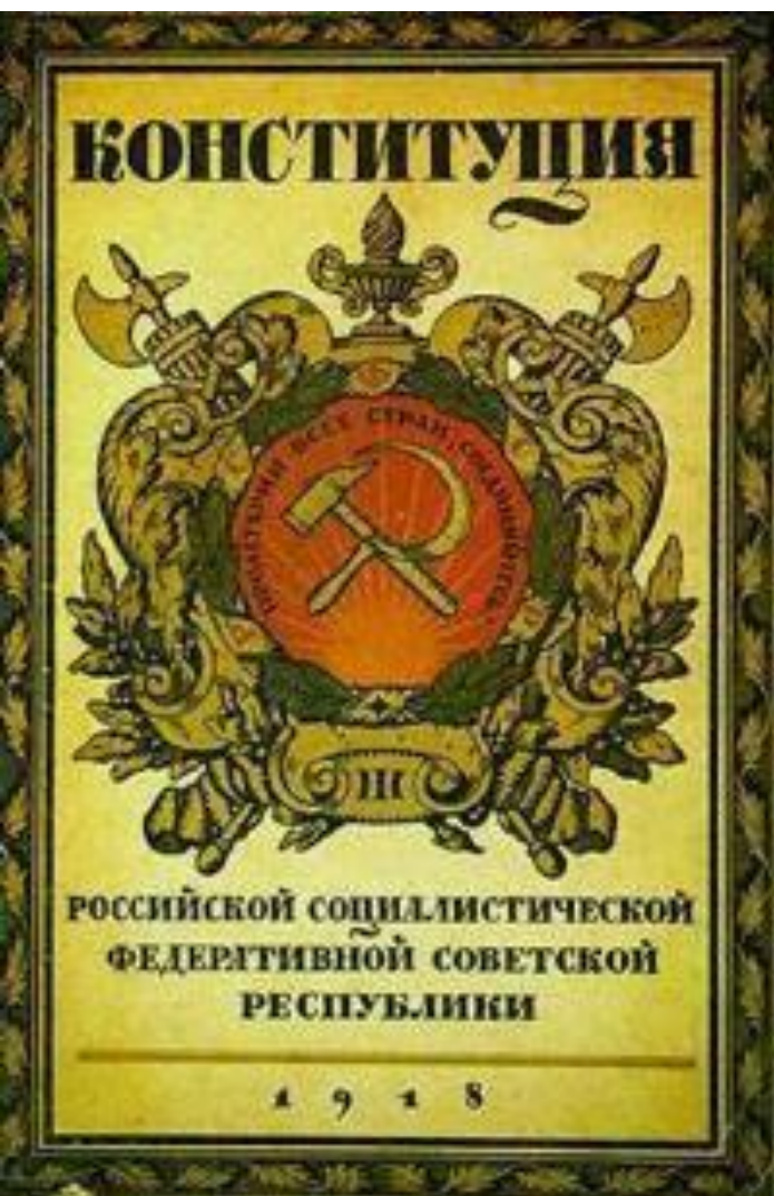
Конституция РСФСР 1918 г.

10 июля 1918 г. V Всероссийский съезд Советов принял Конституцию РСФСР, которая провозглашала Советскую власть в форме диктатуры пролетариата и беднейшего крестьянства. Высшим органом власти становился Съезд Советов, а в промежутках между Съездами - ВЦИК. Исполнительная власть принадлежала Совнаркому.