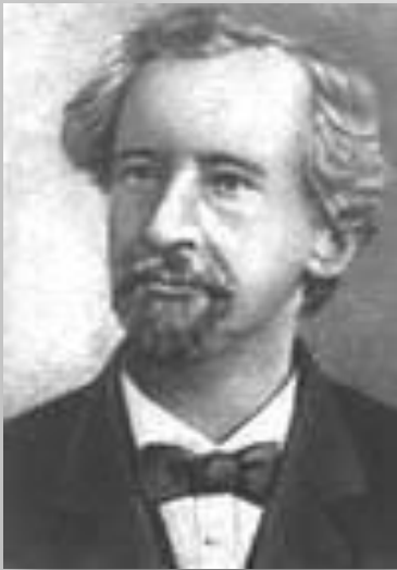
Г. де Фриз

Только через 35 лет открытые Менделеем закономерности были переоткрыты заново независимо друг от друга тремя учёными: