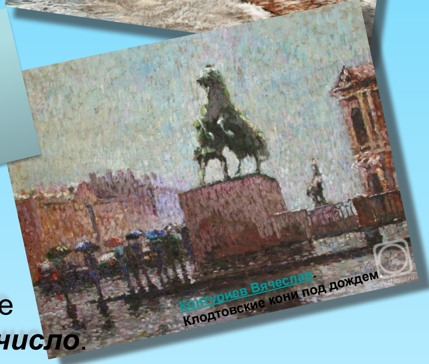
Конзуриев Вячеслав Клодтовские кони под дождем

Ну и ветер жмёт с залива! Дождик хлещет всё сильнее, И насквозь промокли гривы Старых клодтовских коней.