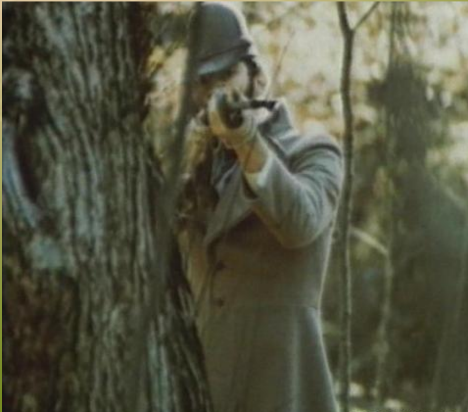
Герой- рассказчик (барин)