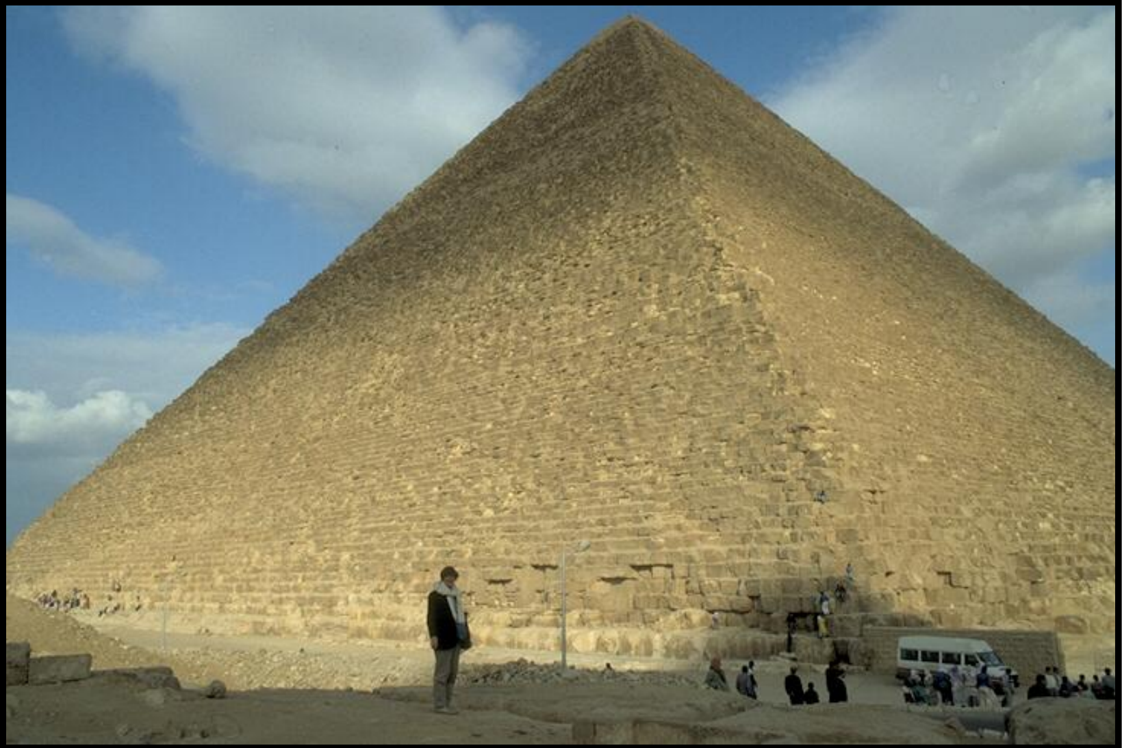
"Горизонт Хуфу" - так называется пирамида Хеопса.