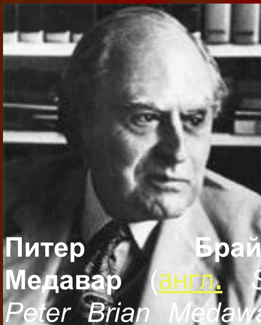
Питер Брайан Медавар ( англ. Sir Peter Brian Medawar ) (р. 28 февраля ) (р. 28 февраля 1915 ) (р. 28 февраля 1915, Рио-де-Жанейро ) (р. 28 февраля 1915, Рио-де-Жанейро — у. 2 октября ) (р. 28 февраля 1915, Рио-де-Жанейро — у. 2 октября 1987 ) — английский биолог.

Особого внимания заслуживают взгляды Бернета на иммунитет как на такую реакцию организма, которая отличает все "свое" от всего "чужого". После доказательств Питером Медаваром иммунной природы отторжения чужеродного трансплантата и накопления фактов по иммунологии злокачественных новообразований стало очевидным, что иммунная реакция развивается не только на микробные антигены, но и тогда, когда имеются любые, пусть незначительные антигенные различия между организмом и тем биологическим материалом (трансплантатом, злокачественной опухолью), с которым встречается организм. Строго говоря, ученые прошлого, включая Мечникова, понимали, что предназначение иммунитета - не только борьба с инфекционными агентами. Однако интересы иммунологов первой половины нашего столетия концентрировались в основном на разработке проблем инфекционной патологии. Необходимо было время, чтобы естественный ход научного познания позволил выдвинуть концепцию роли иммунитета в индивидуальном развитии. И автором нового обобщения был Бернет.