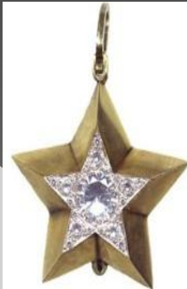
Маршальская Звезда «малого» типа