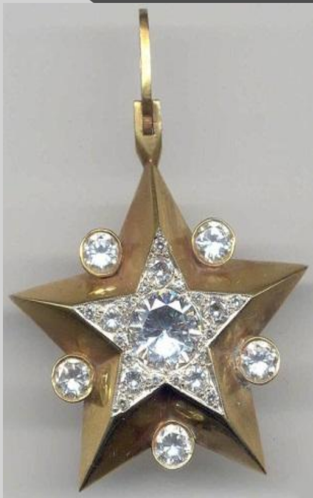
Маршальская Звезда «большого» типа