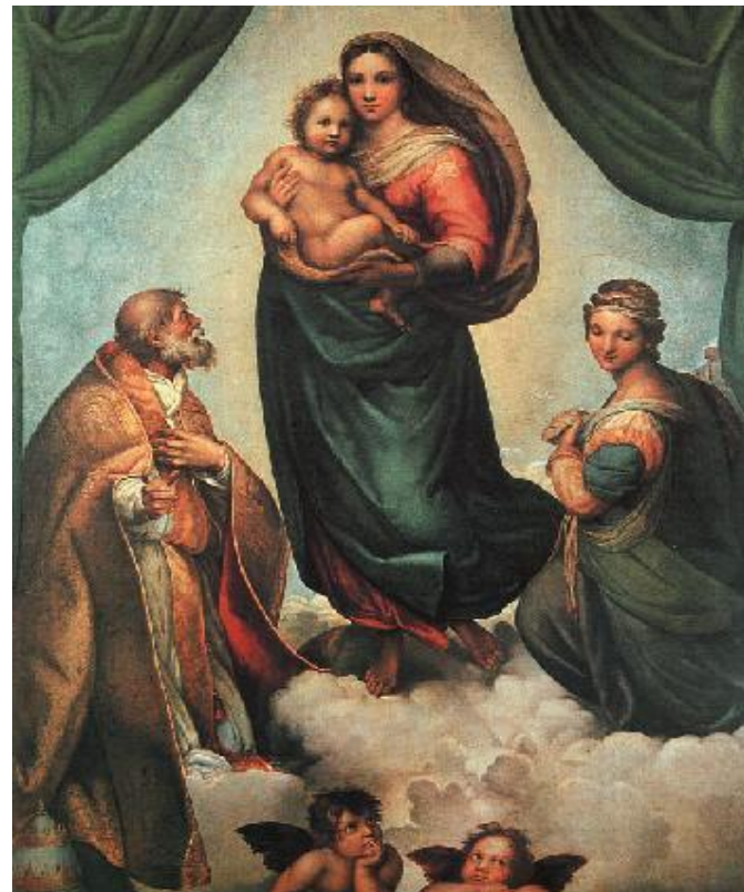
Рафаэль Санти «Сикстинская мадонна»