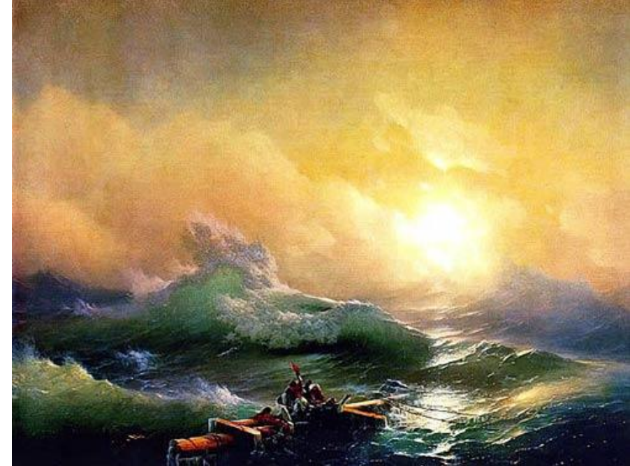
Айвазовский «Девятый вал»