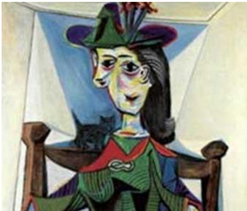
Пабло Пикассо «Дора Маар с кошкой»