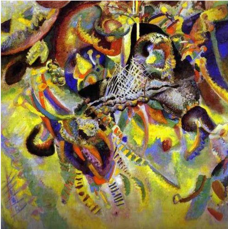
Кандинский «Апофеоз абстракции»