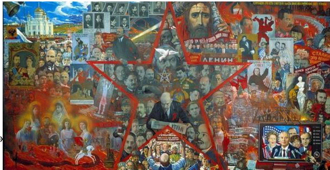
Илья Глазунов «Великий эксперимент»