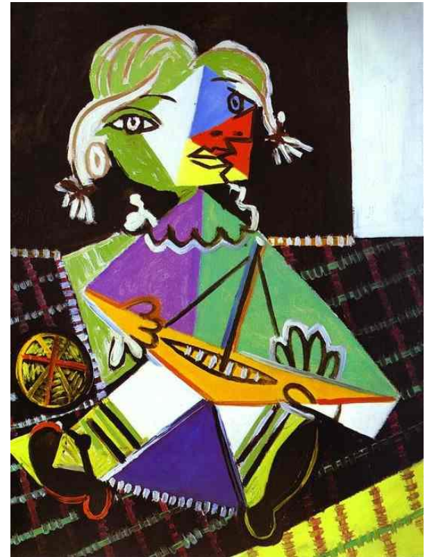
Пабло Пикассо «Девочка с лодочкой»