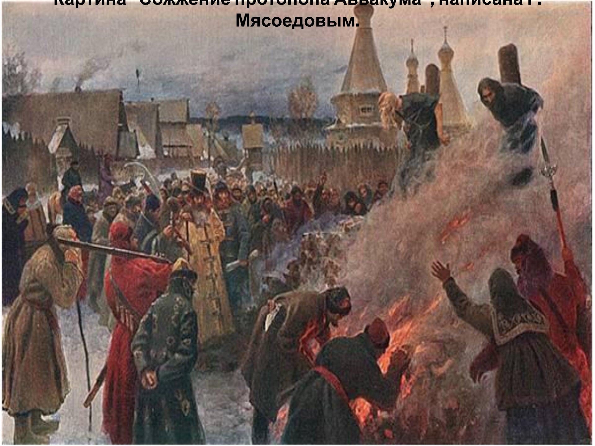
Картина «Сожжение протопопа Аввакума», написана Г. Мясоедовым.