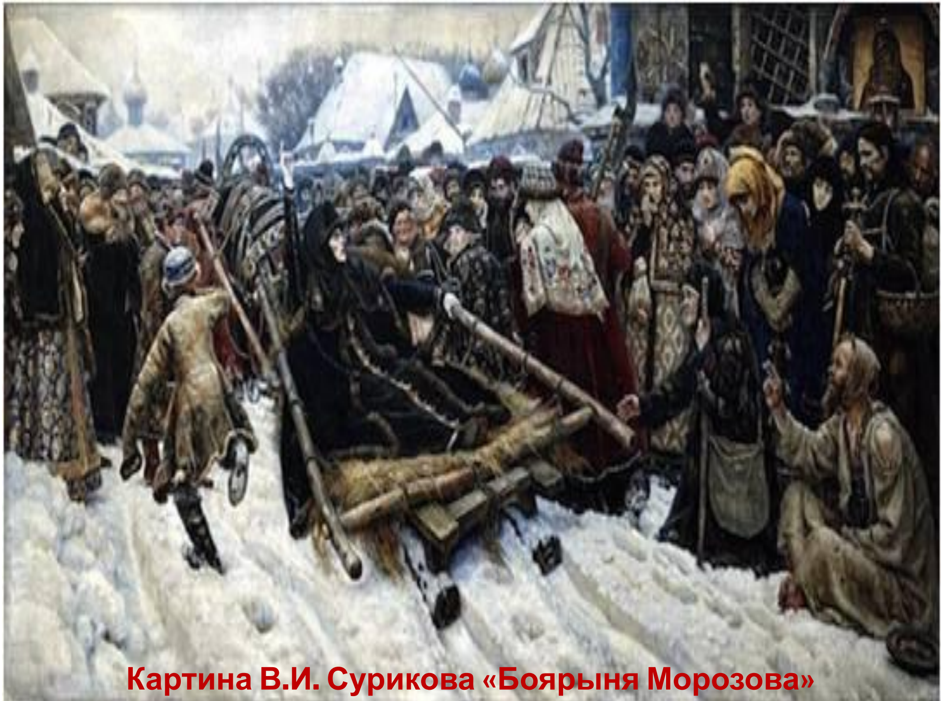
Картина В.И. Сурикова «Боярыня Морозова»