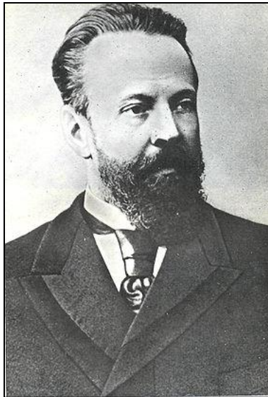
С.Витте. Министр финансов империи в 1892—1903 гг.

Отставание аграрного сектора, со- хранение феодалных пережитков