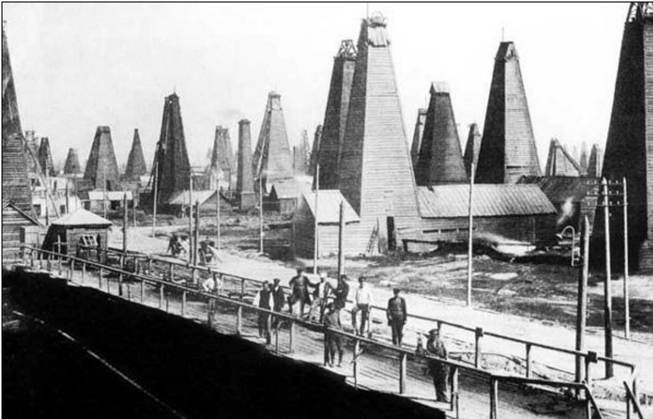
Корпуса монополии «Нобель- Мазут» в Баку.

4. На волне мирового экономического кризиса 1900-1903 гг. в России пострадали предприятия тяжелой промышленности, погибли слабые, малые предприятия, отстающие в финансовом и техническом оснащении. Закрылось свыше 3 тыс. предприятий , на которых работало 112 тыс. рабочих . Ответом капитализма стало создание монополий . Крупнейшими были «ПРОДАМЕТА» (1901), «Продуголь», «Продвагон», «Гвоздь», объединивших под своим началом десятки крупных предприятий.