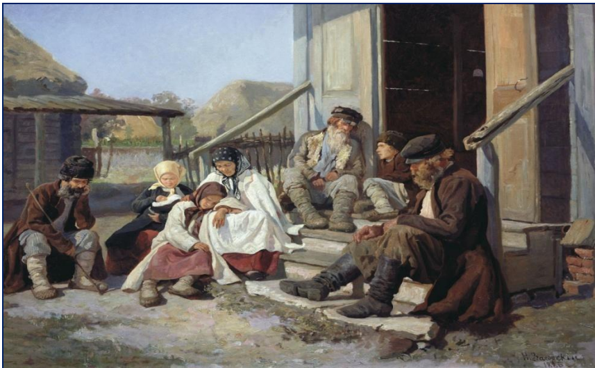
Крестьянская семья на отдыхе. Начало XX века.

5. В начале XX в. Россия- первая в мире по объему сельхозпродукции. На долю России приходилось 50% мирового сбора ржи, 20% пшеницы, 25% экспорта зерна. Несмотря на это С/Х развивалось самотеком. Поля обрабатывались вручную сохой и бороной, не было удобрений, урожайность низкая. В деревне часто голод. Тормозило развитие С/Х сохранение общины и помещичьих хозяйств. На 20 млн. крестьянских хозяйств приходилось 130 тыс. помещичьих. У общины было 4/5 всей крестьянской земли. Также проблемой были «лишние рты» в деревне. Земли всем не хватало, а продуманной переселенческой политикой государство не занималось.