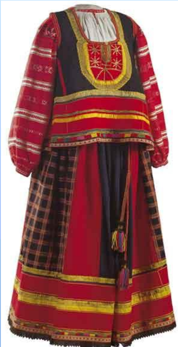
Рубаха, понева, навершник.