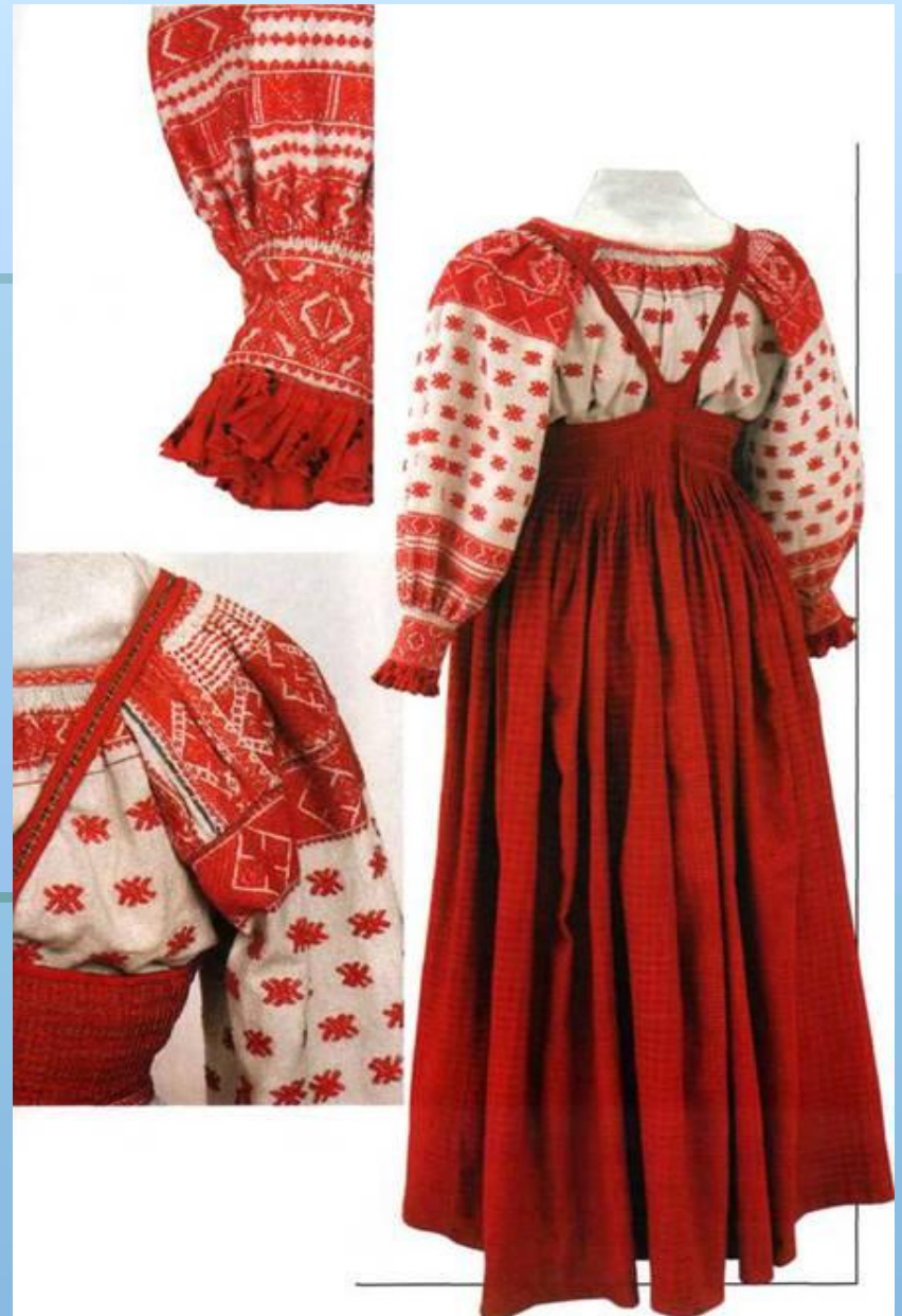
Рубаха и сарафан