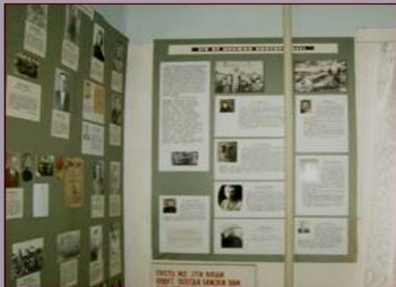
Экспозиция «ПОКЛОНИСЬ ПОДВИГУ».

О жизни селян во время оккупации фашистами познакомит экспозиция «ЭТО НЕ ДОЛЖНО ПОВТОРИТЬСЯ». Большая часть экспозиции посвящена узникам Германии. Воспоминания, фотографии, биографические справки и другие документы свидетельствуют о невероятно тяжелой жизни в неволе бывших узников фашистской Германии.