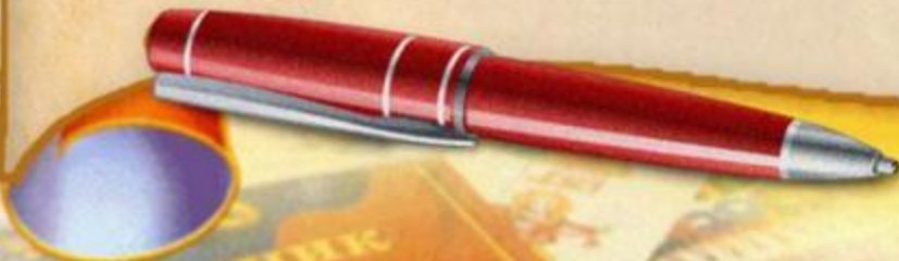
Расписная матрёшка – Сергиев Посад