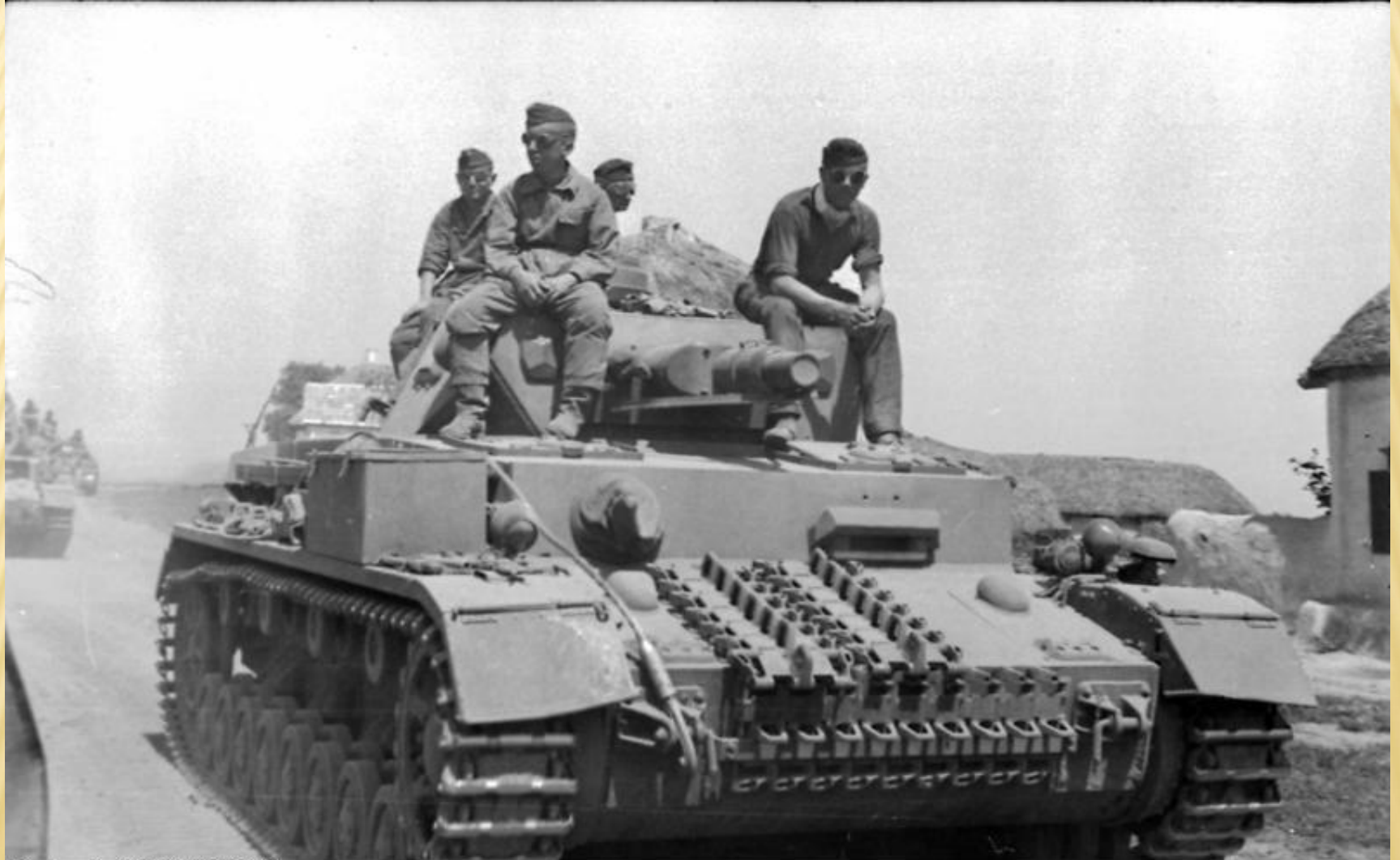
Juni 1942