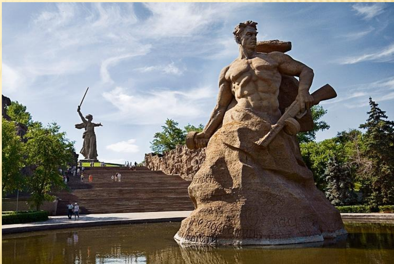
На фото: Мамаев Курган

расположен в Центральном районе города Волгограда, где во время Сталинградской битвы происходили ожесточённые бои (особенно в сентябре 1942 года и январе 1943) продолжительностью 200 дней.