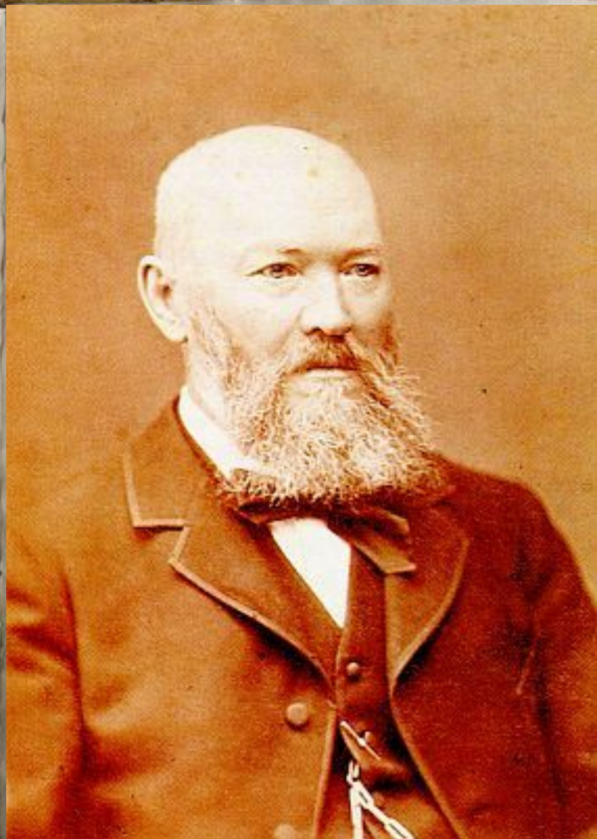
Александр Николаевич Островский