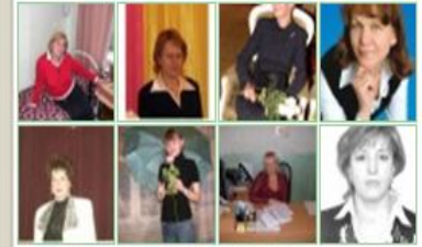
...показать весь список...