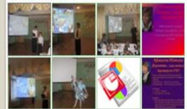
...показать весь список...