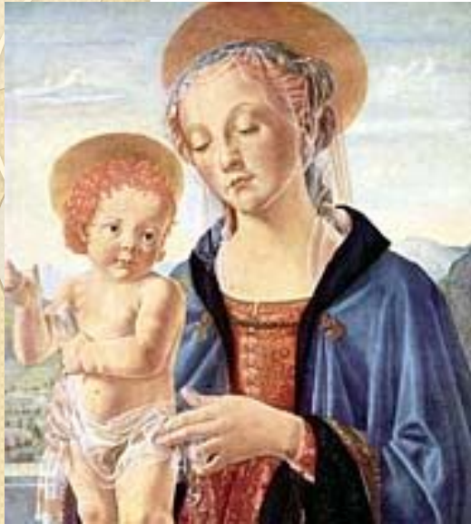
Андреа Верроккио. Мадонна с младенцем. 1470-1475 годы. Метрополитен-музей в Нью-Йорке.

Леонардо родился в семье богатого нотариуса. Он сложился как мастер, обучаясь у Андреа дель Верроккьо в 1467-1472 годах. Методы работы во флорентийской мастерской того времени, где труд художника был тесно сопряжен с техническими экспериментами, а также знакомство с астрономом П. Тосканелли способствовали зарождению научных интересов юного Леонардо.