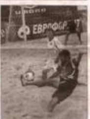
Команда «Корсика» — 1:0. У другому таймі після перебою на 5-й хвилині захарківський гол забиває переможний удар. «Корсика» перемогла з рахунком 1:0. У другому таймі після перебою на 5-й хвилині захарківський гол забиває переможний удар.

В Україні немає професійного пляжного футболу, хоча в останні роки він стає все більш популярним. Найбільше це стосується Харківщини, де влітку на пляжах розпочинаються турніри з пляжного футболу. У цьому році участь в ньому взяли команди з Харківщини, Дніпропетровщини, Львівщини, Чернівецької області та інших регіонів України. Турнір проходив на пляжі в Харкові. Команди грали в футбол на піску. Це була дуже цікава гра. Команди грали в футбол на піску. Це була дуже цікава гра. Команди грали в футбол на піску.