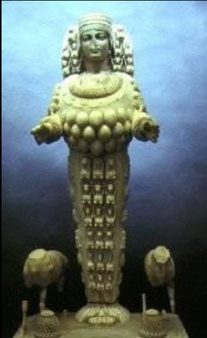
Ефес касабасьнда Артемис пугу. (Апо 19)