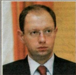
Арсеній ЯЦЕНЮК, экс-кандидат в президенти України:

«Вона веде себе як стовідсоткова єврейка. Як тільки Тимошенко побачила, що я виграв в неї тут, на Заході, вона найняла кримінального авторитета Рагушняка, щоб назвати мене жидом. І це робить Тимошенко, яка і є повноцінною єврейкою! Вірай цинічно. Але повністю в її - жидівському - стилі. Це і є її жидівська філософія: згодиться будь-який бруд для того, щоб перемогти».