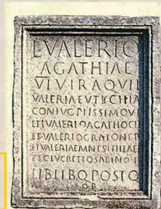
Это римская древняя табличка, написанная 2000 лет назад.