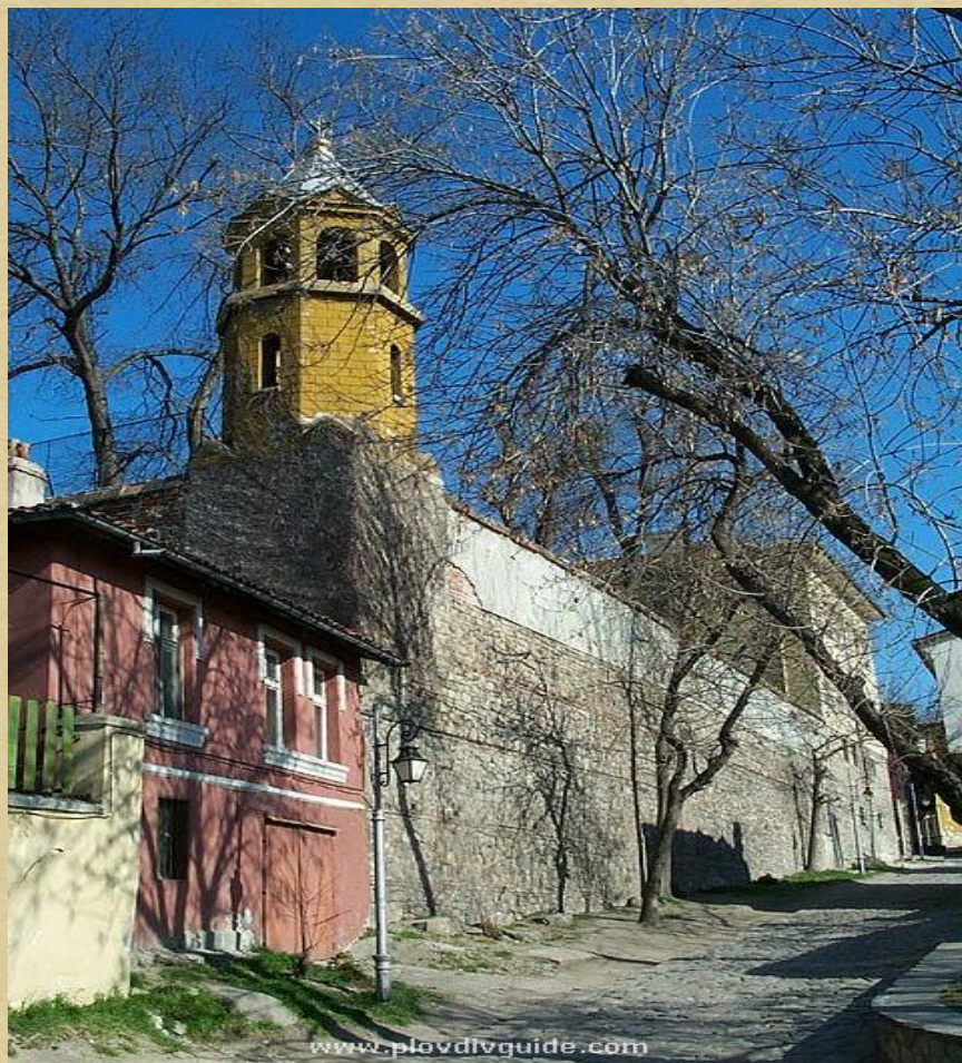
Арменската църква в Пловдив