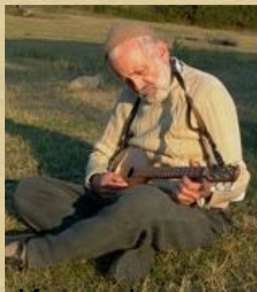
Ицках Финци- актьор