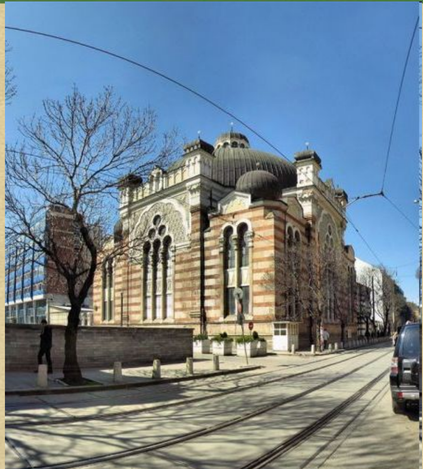
Синагогата в София