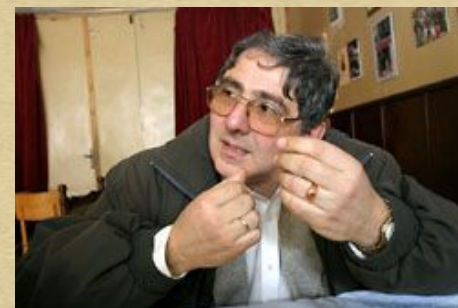
Хайгашот Агасян- композитор