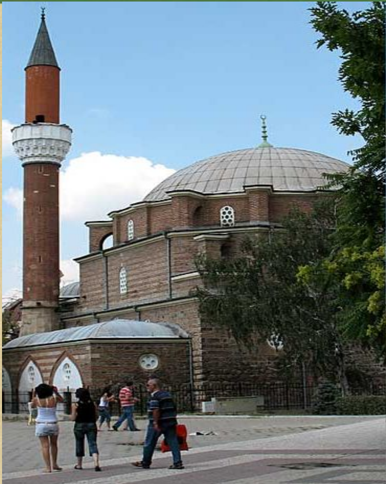
Джамията в София

Живеем с хора, които имат различни от нашите традиции и обичаи. Техните културни паметници също се различават.