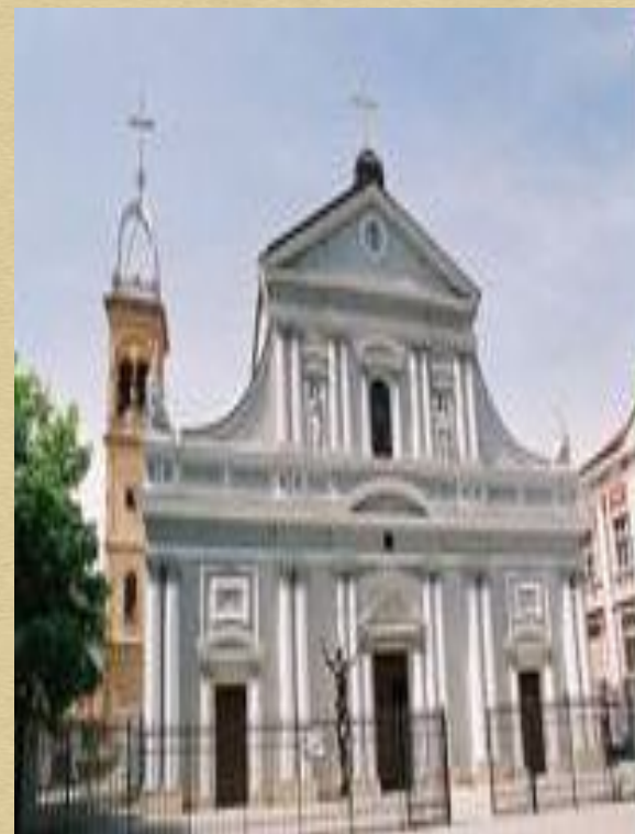
Католическата църква в Пловдив