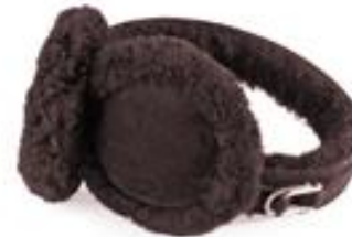
shearling "double u"