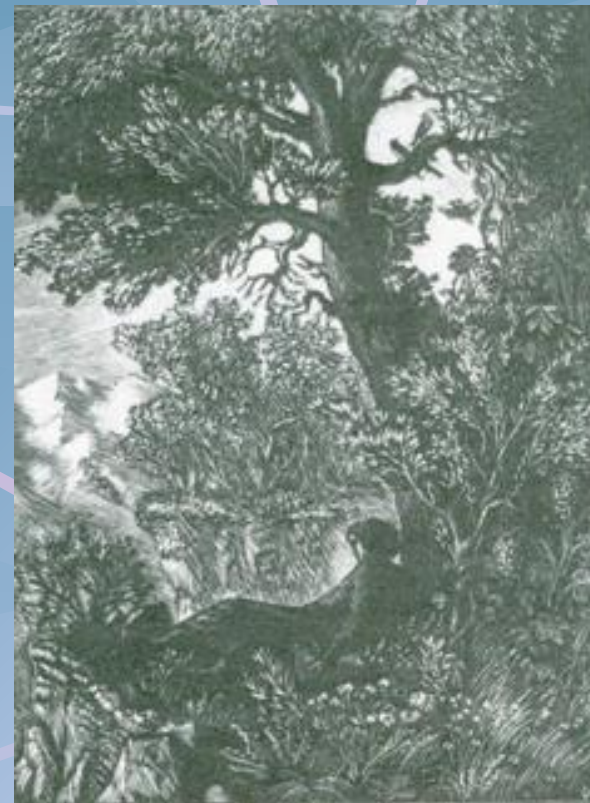
„МЦИРИ” - илюстрация