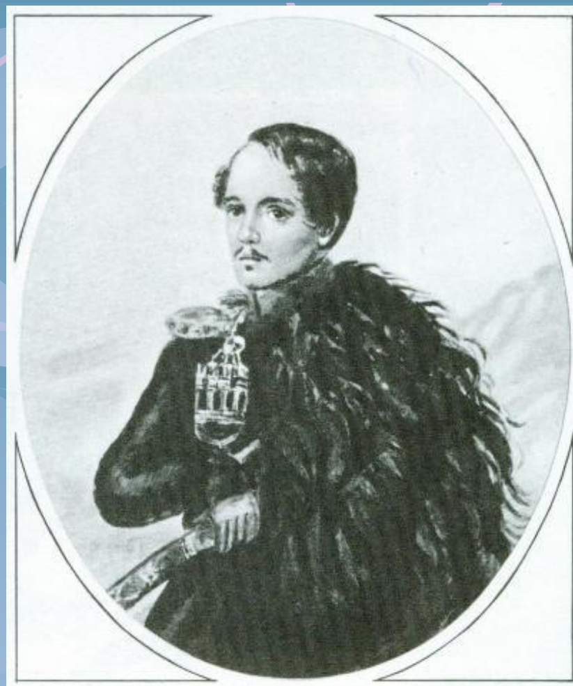
Автопортрет акварел 1837 – 1838 г.