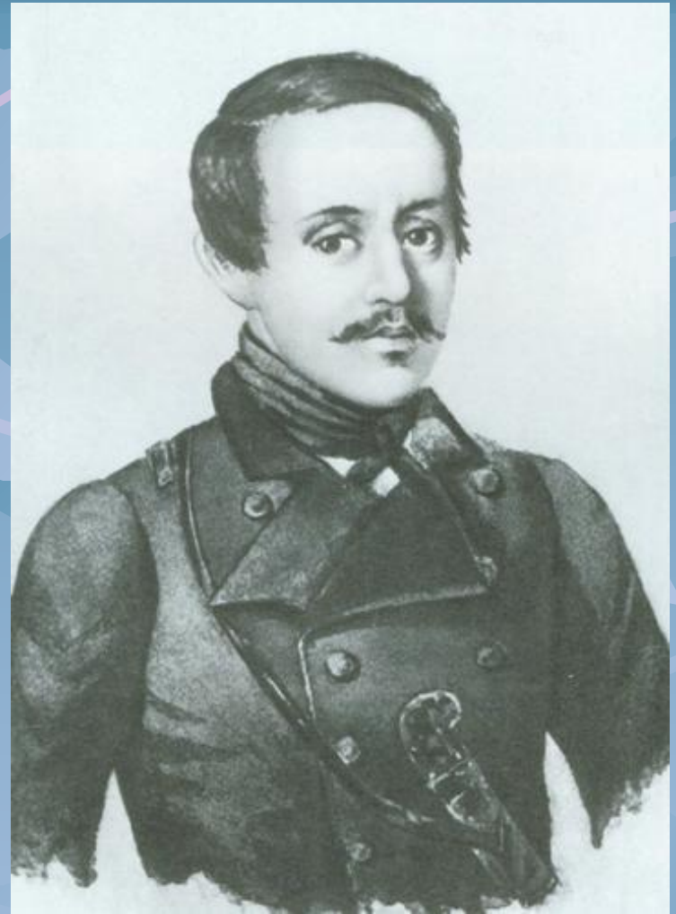
М. Ю. ЛЕРМОНТОВ Акварел К. А. Горбунов 1841 г.