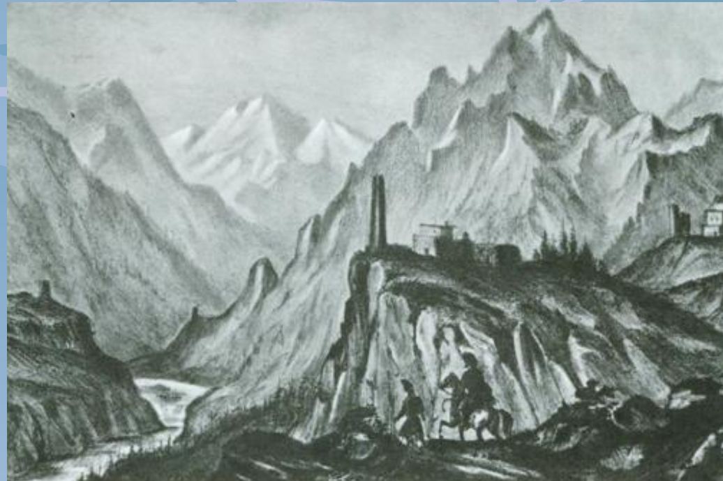
Крестова планина Автолитография на Лермонтов

Аз със сърцето си съм твой – винаги и навсякъде твой.