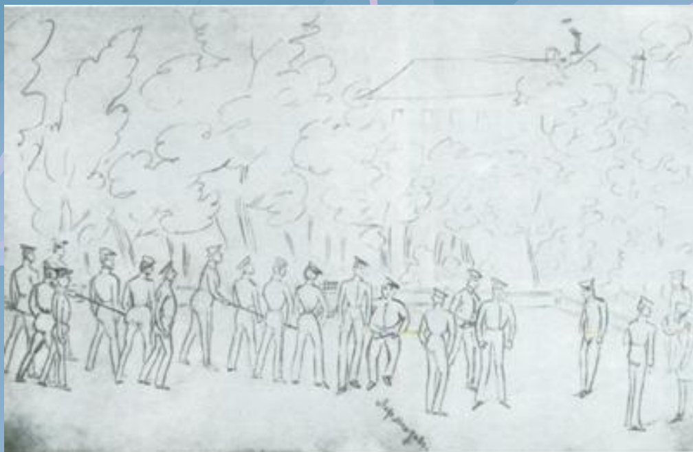
Маршировка на юнкерите Рисунка от албума на Л. Поливанов