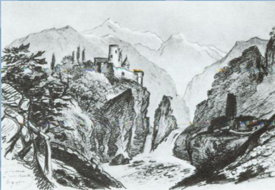
рисунок на Лермонтов 1837 г.