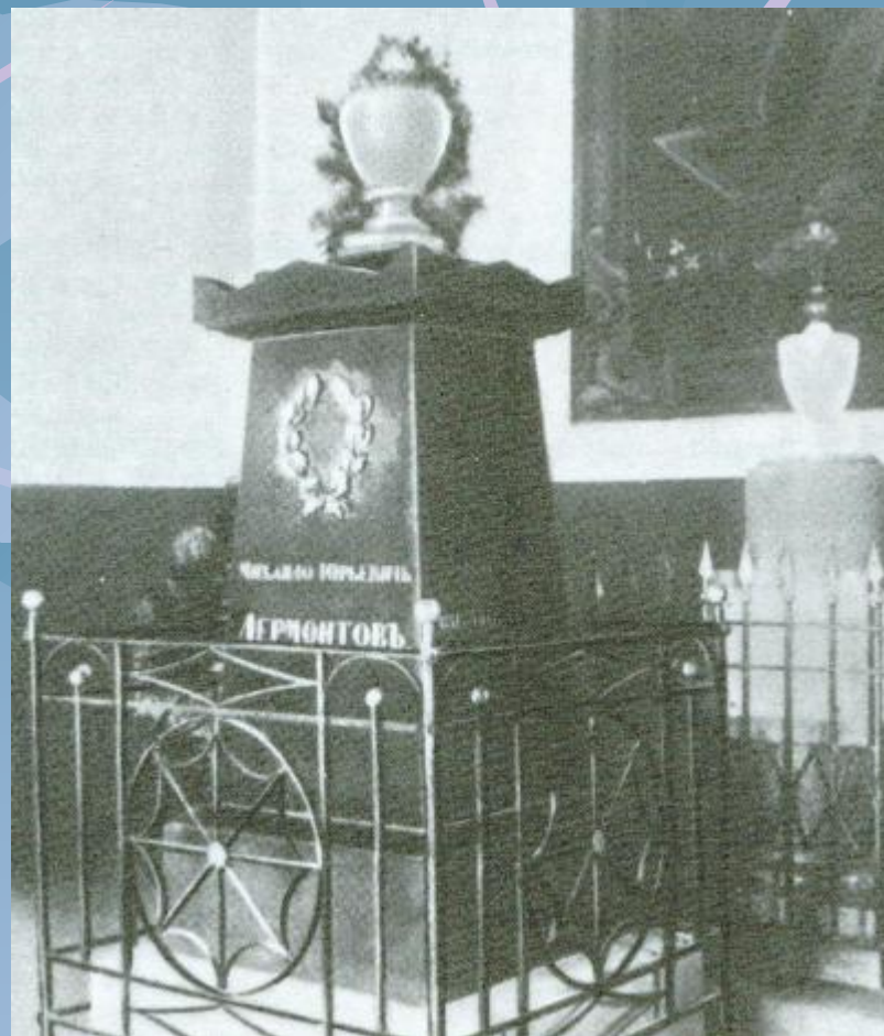
Тархан, могилата на М. Ю. Лермонтов фотография

На 23. 04. 1842г. Гробът с тялото на великия руски поет е установен във фамилната гробница на Арсениеви в Тархан. Където неговата баба е издействала преместването на тялото му от Пятигорск.