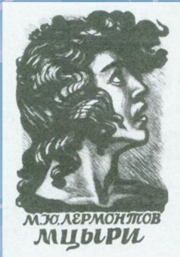
„МЦИРИ” – обложка

Мцири от грузински означава послушник /млад недопуснат до служба монах/, а също и пришелец, човек без род и племе.